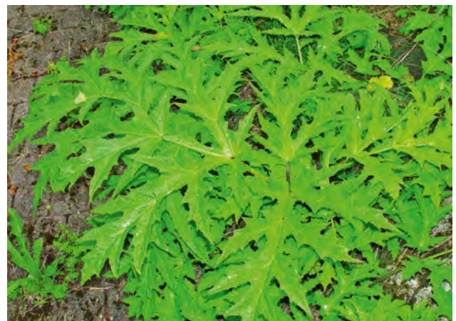
Blatt des Riesen-Bärenklaus

Boxenkompostierung, in einer Co-Vergärung mit Hygienisierungsschritt oder in einer thermophilen Feststoffvergärung.