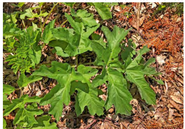
Blatt des einheimischen Wiesen-Bärenklaus