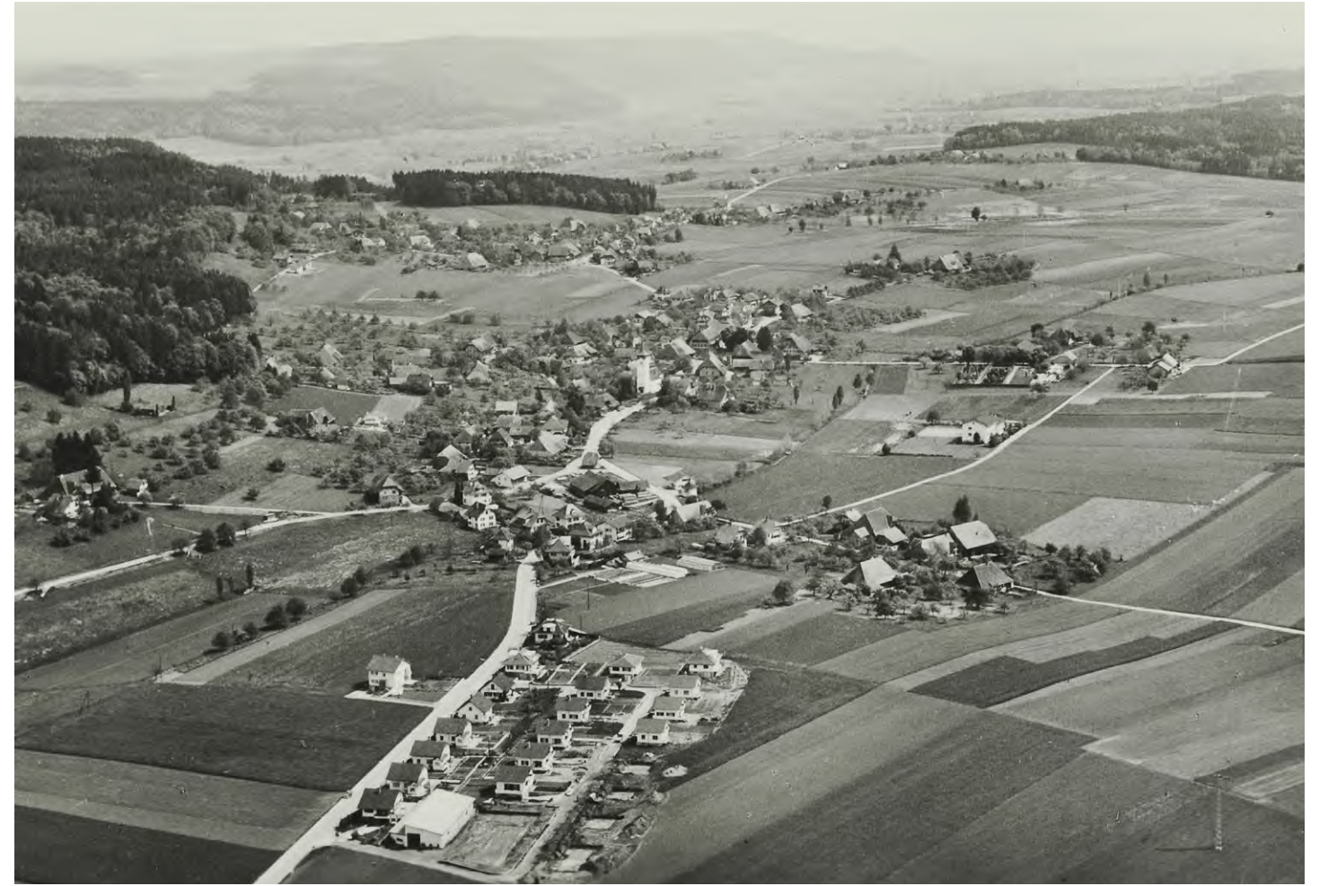
Grossaffoltern aus der Luft, um 1960