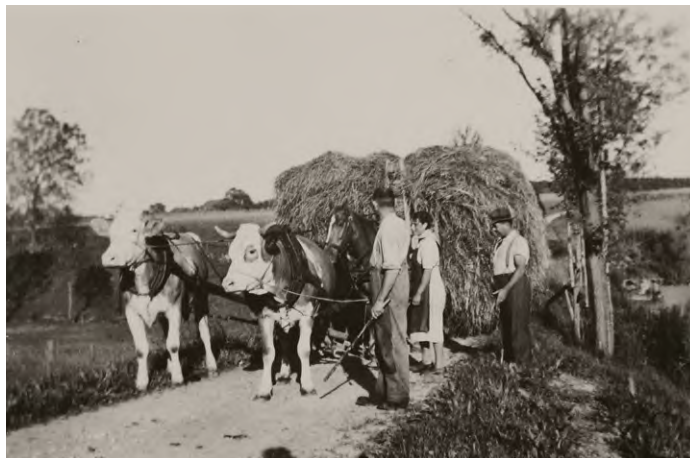
Von oben links: Heuen in Ammerzwil, Grossaffoltern, Hasenacher Ottiswil und Hof Grossaffoltern