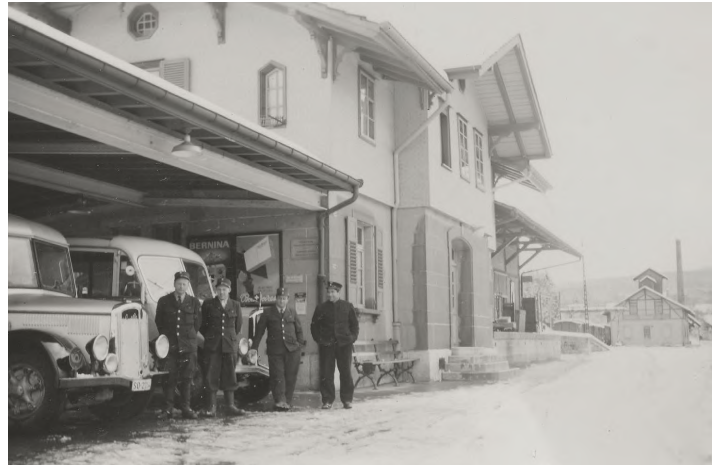
Von links: Postauto-Chauffeur (Strecke Suberg – Büren a.A.), Posthalter Ammerzwil (der die Post jeweils am Bahnhof Suberg abholte), Postauto-Chauffeur (Strecke Suberg – Aarberg) und ein Angestellter der Bahn, Bahnhof Suberg, 1959