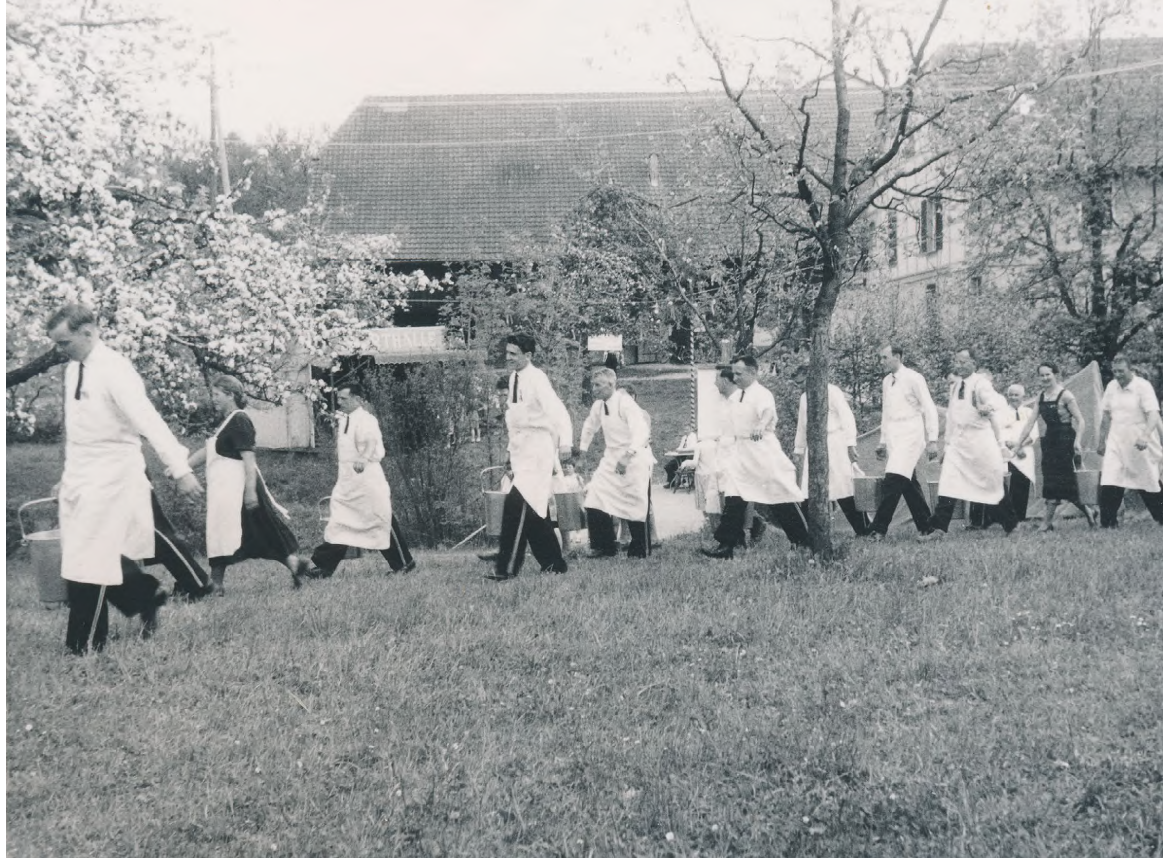
Vorbereitungen für den Kantonalen Musiktag in Suberg, 1959