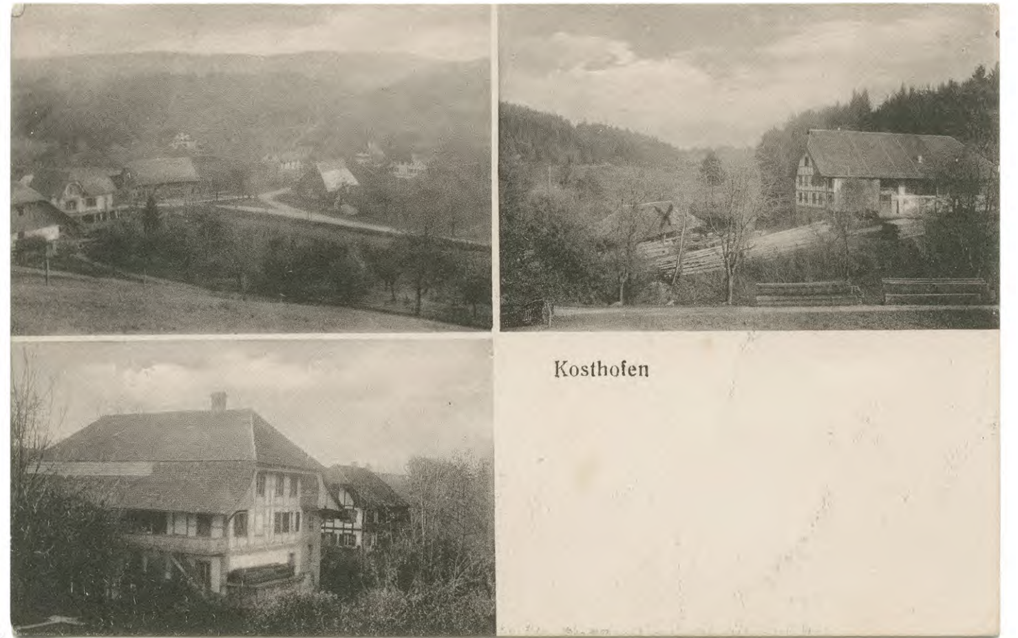
Postkarte, Kosthofen, 1922