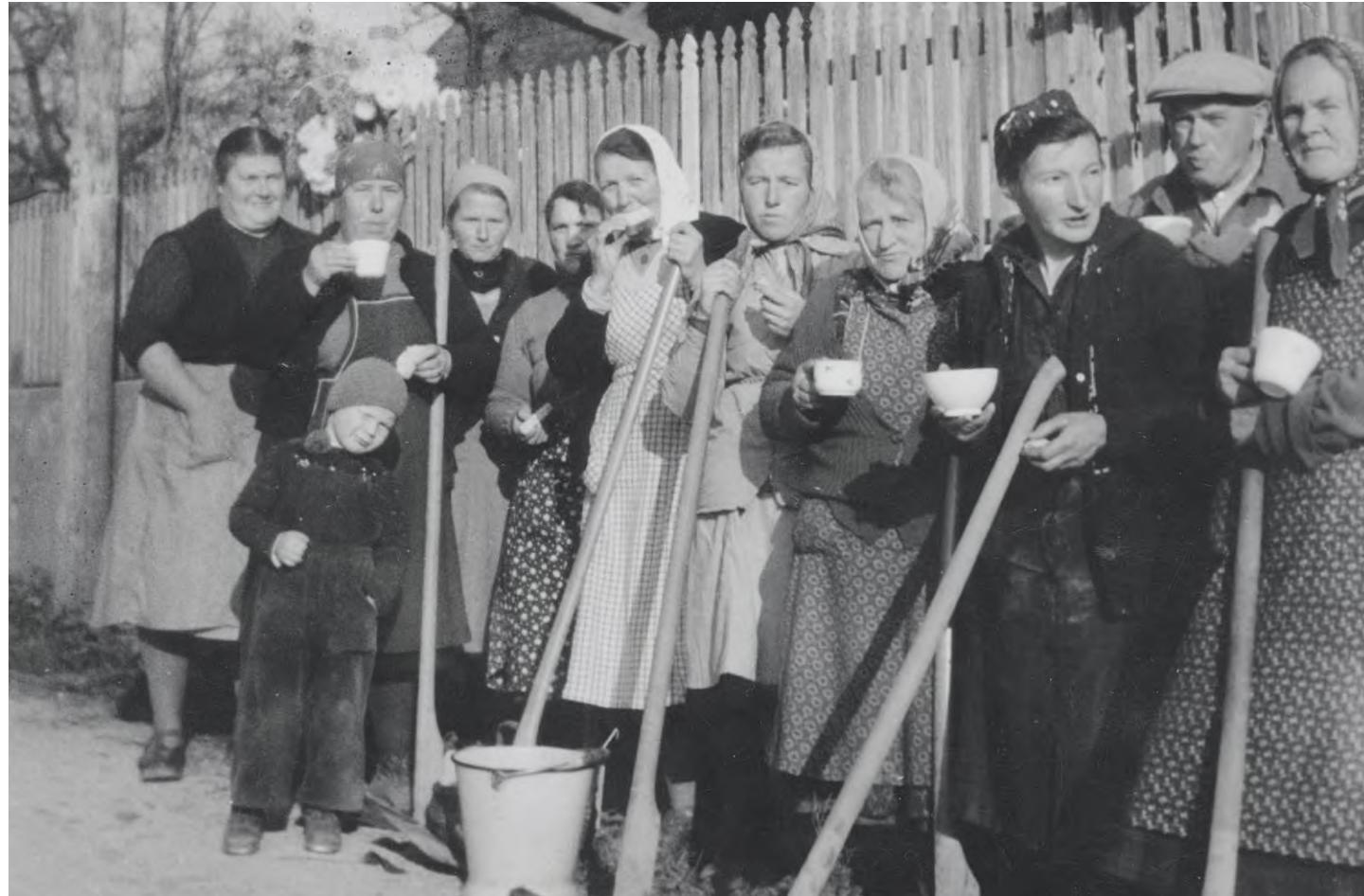
Pause während dem «Gmeinwärc». Die offizielle Bezeichnung für das «Gmeinwärc» war «Handgemeindewerk». Das Wegwesen war vor der Zentralisation in der Verantwortung der Orts- resp. Schulgemeinden und stand unter der Leitung eines Wegmeisters. Da praktisch alle Wege Naturwege waren, erforderte deren Unterhalt viel Handarbeit. Die Einwohner erhielten pro Halbtage eine Gutschrift für die Steuern. Wer sich nicht am «Gmeinwärc» beteiligte, bezahlte mehr Steuern. Ammerzwil, 1956