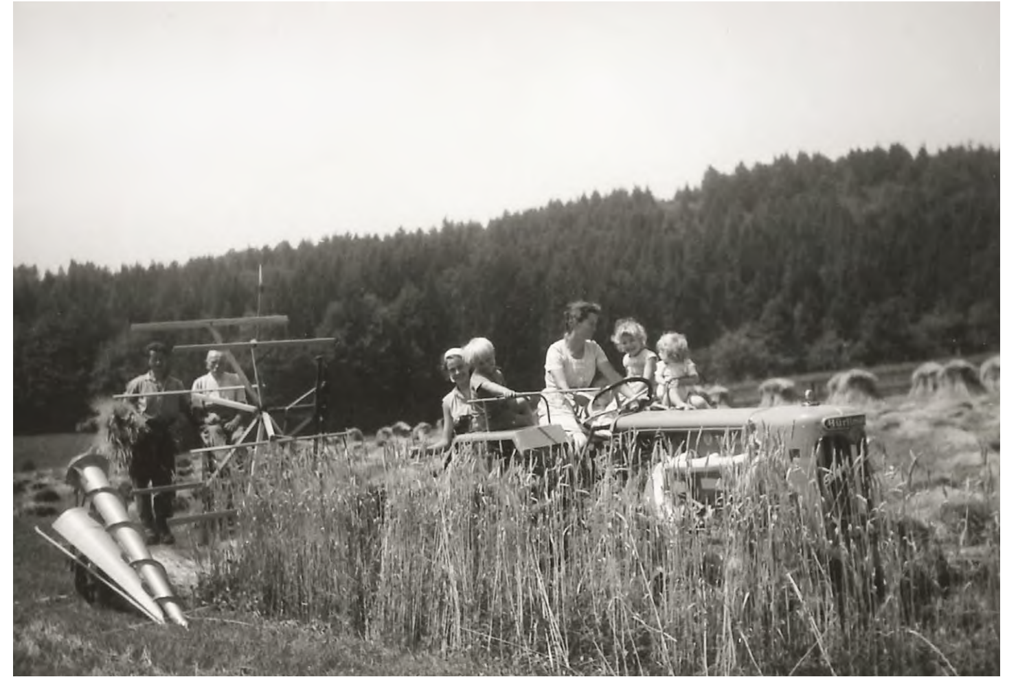
Rosmarie Friedrich steuert einen Traktor mit angehängter Lieuse. Im Hintergrund sind Puppen zu sehen, bestehend aus zusammengetragenen Bündeln (Garben). Als Puppen zusammengestellt, war das Korn vor Regen sicher. Vorimholz, 1963