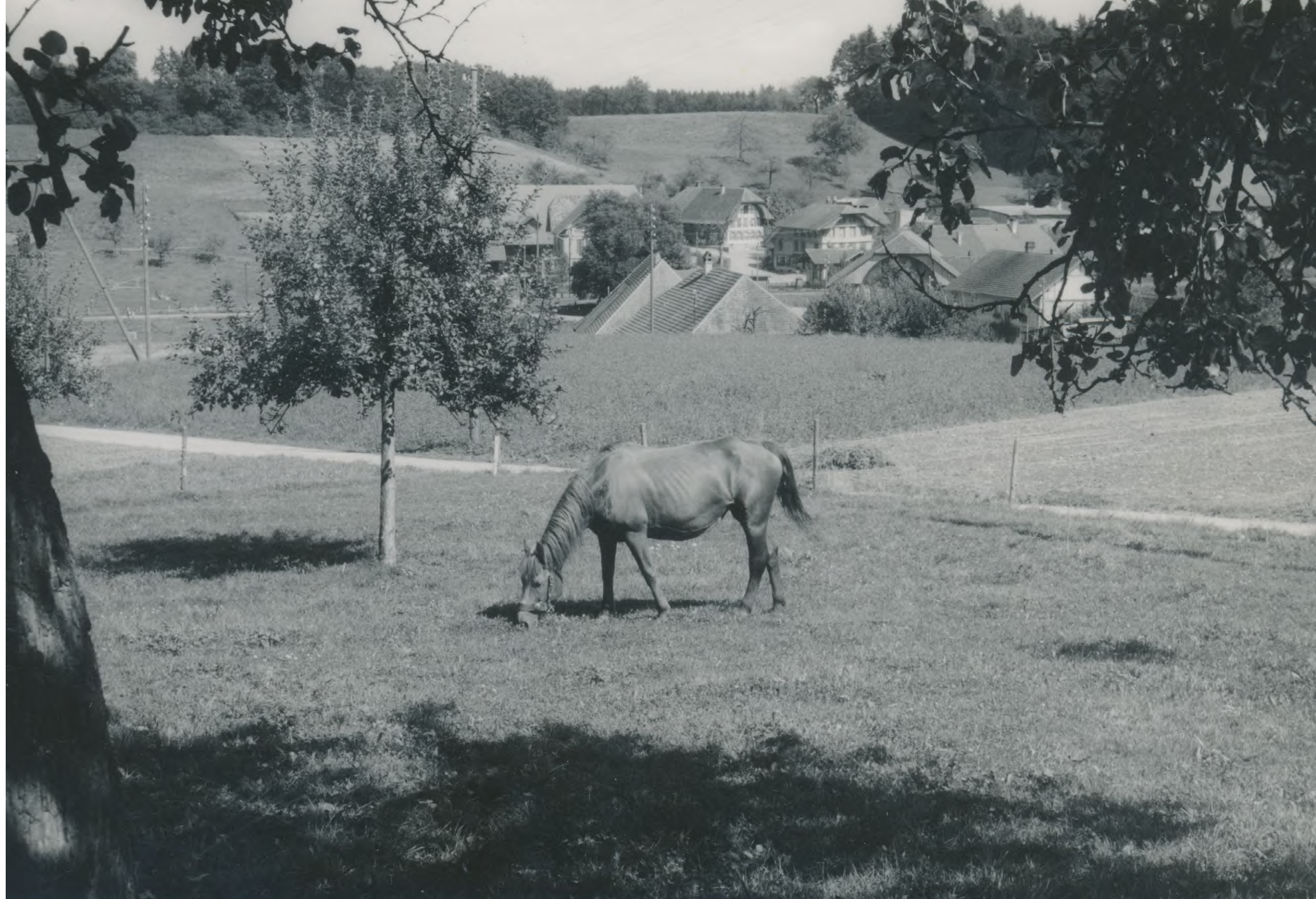
Sicht auf Dorfzentrum Kosthofen, undatiert