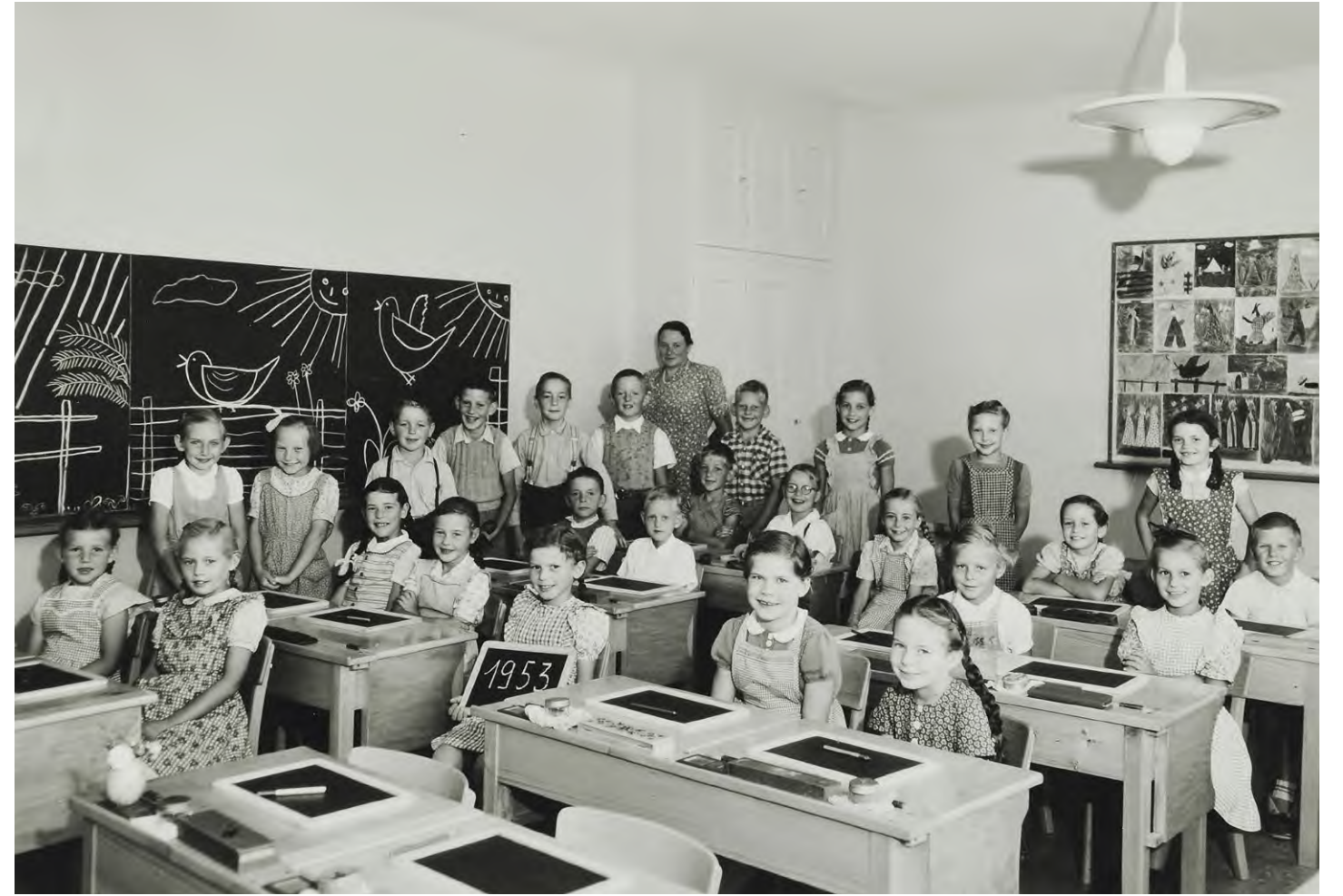
Erster Unterricht im neuen Schulhaus, Grossaffoltern, 1953