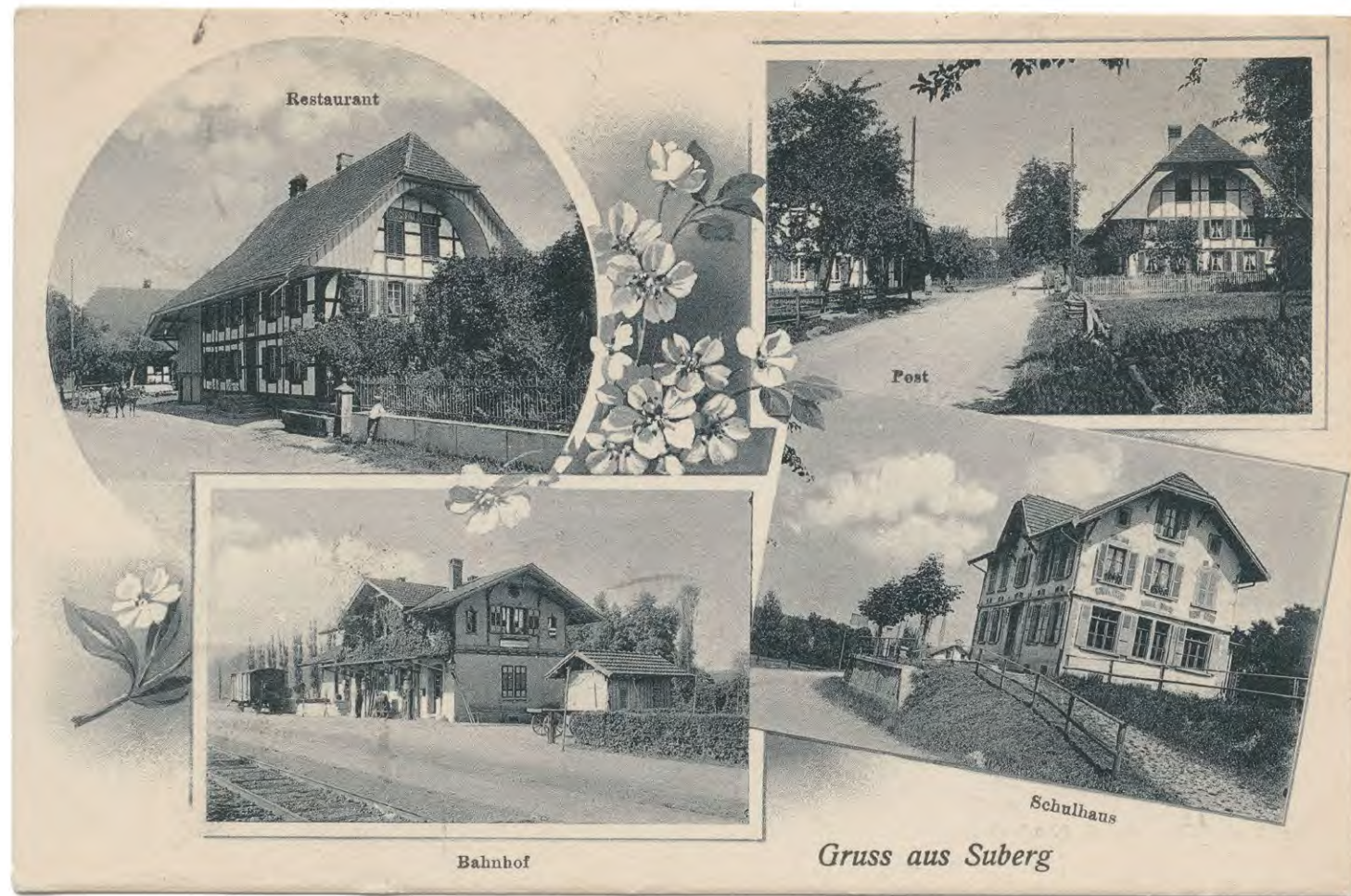
Postkarte, Suberg, 1910