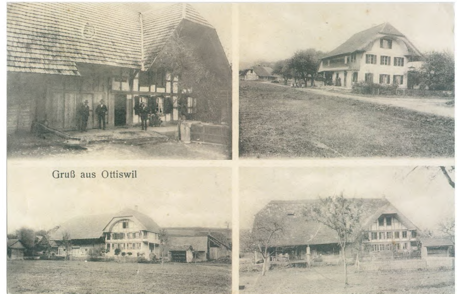
Postkarte, Ottiswil, undatiert