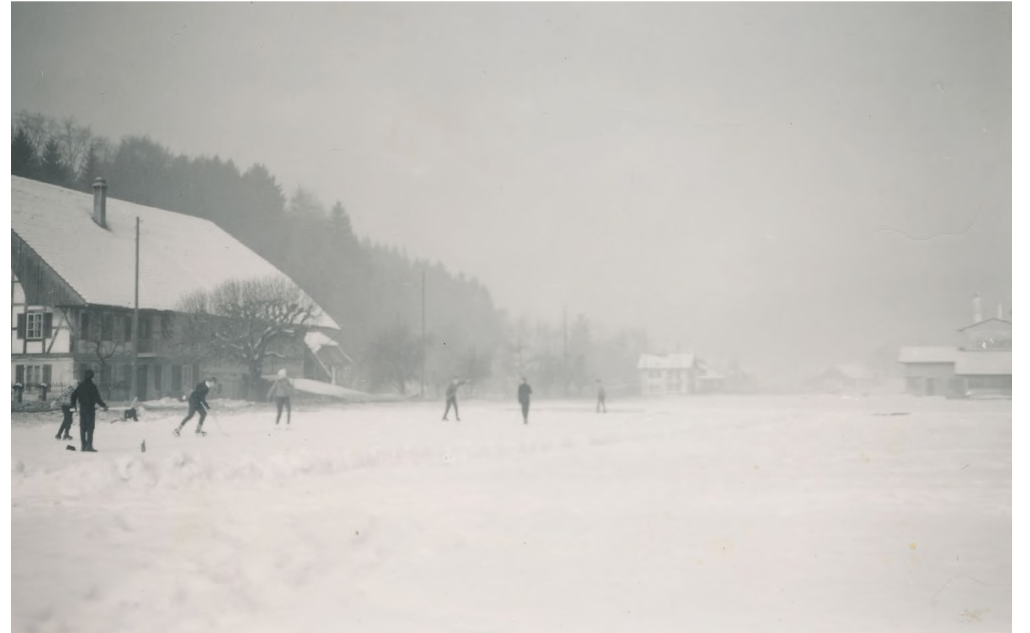
Hockeyclub Suberg auf dem Acker vor der Landwirtschaftlichen Genossenschaft, Suberg, 1960