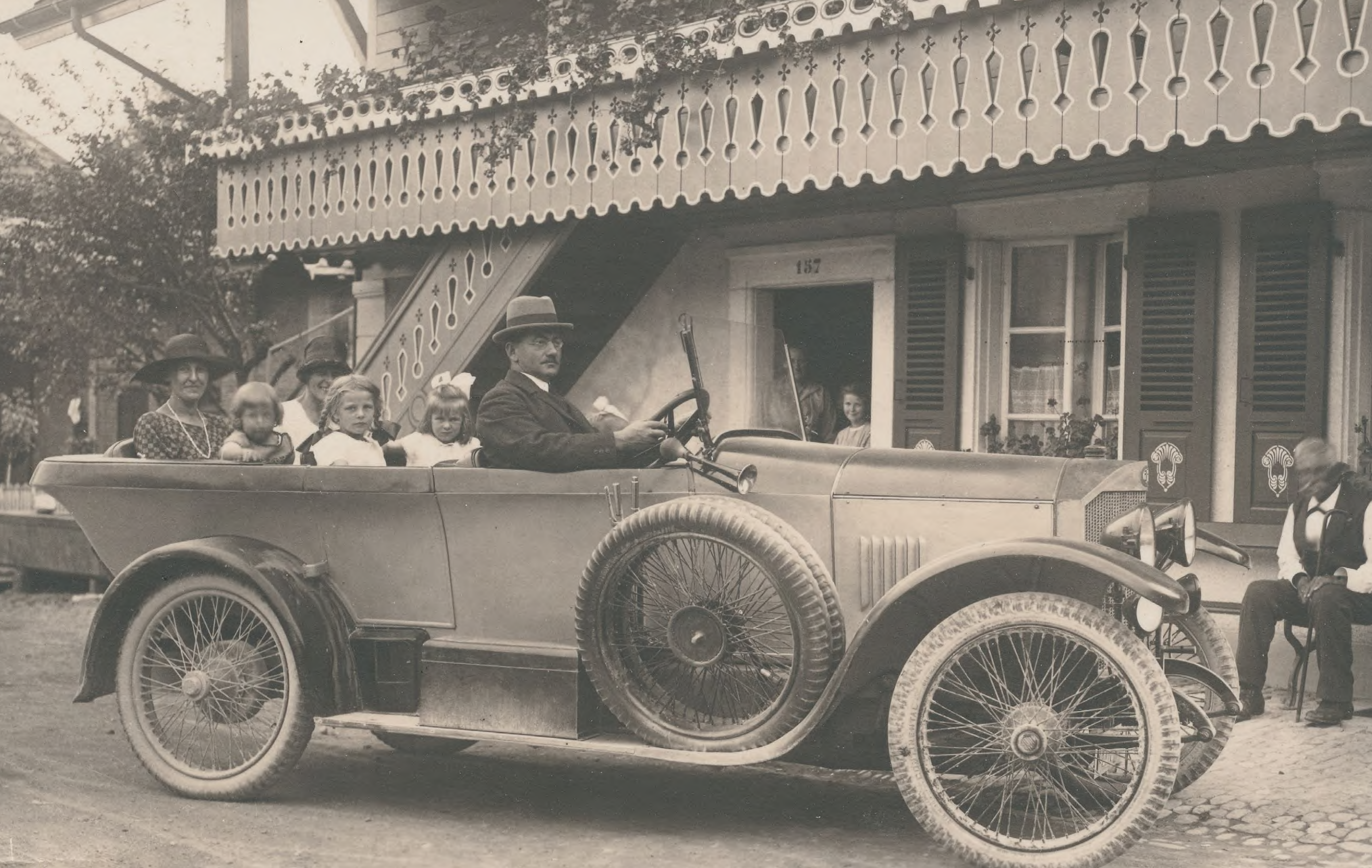
Metzgerfamilie Loder vor einem Sonntagsausflug, Grossaffoltern, 1926