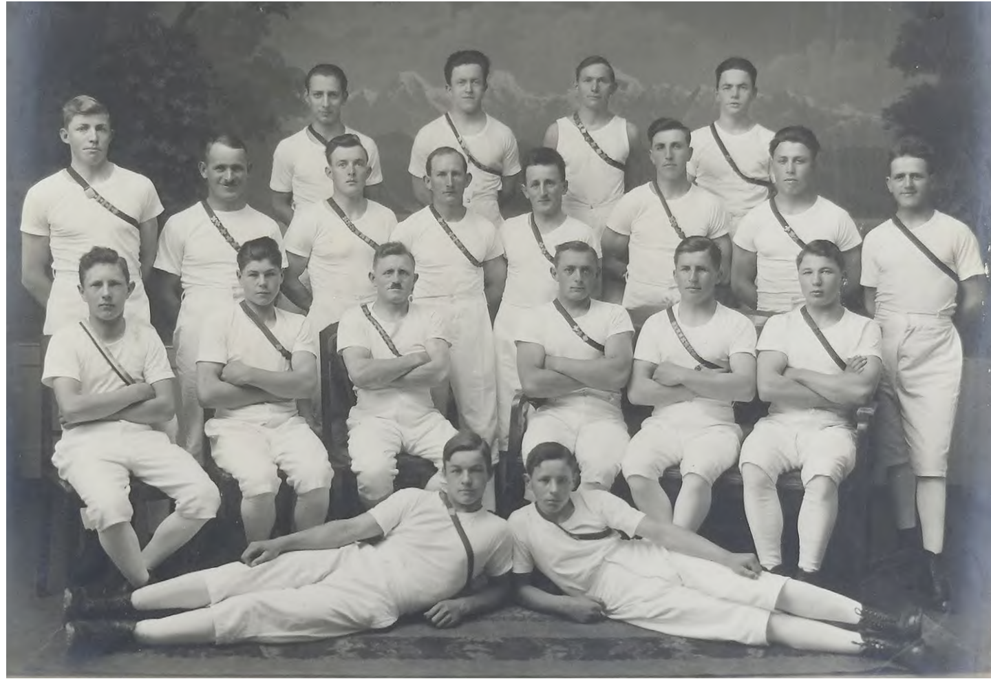
Turnverein Grossaffoltern, 1930