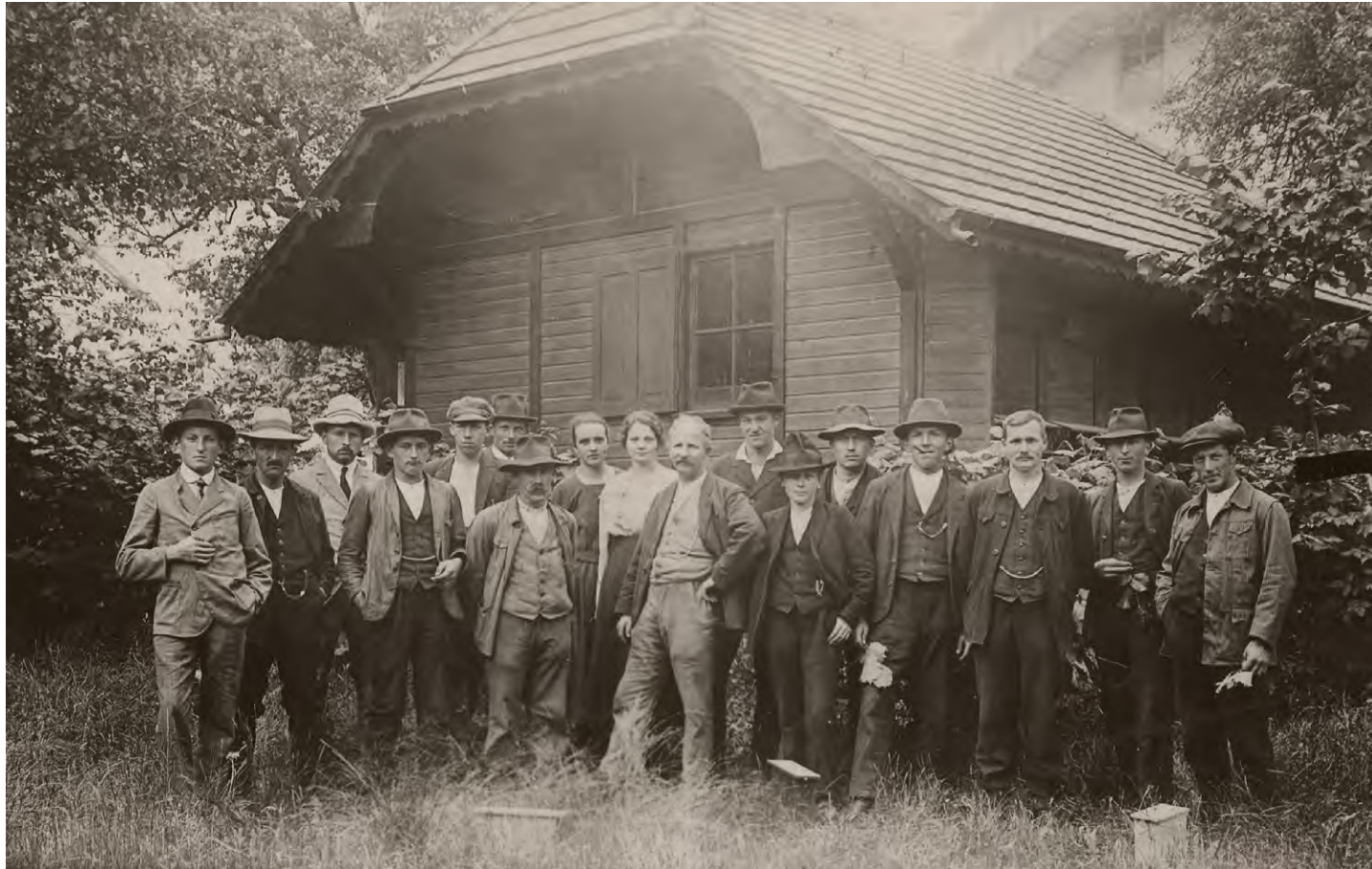
Mitglieder des Bienenzüchtervereins Aarberg vor dem Bienenhaus beim Schulhaus Vorimholz, um 1920