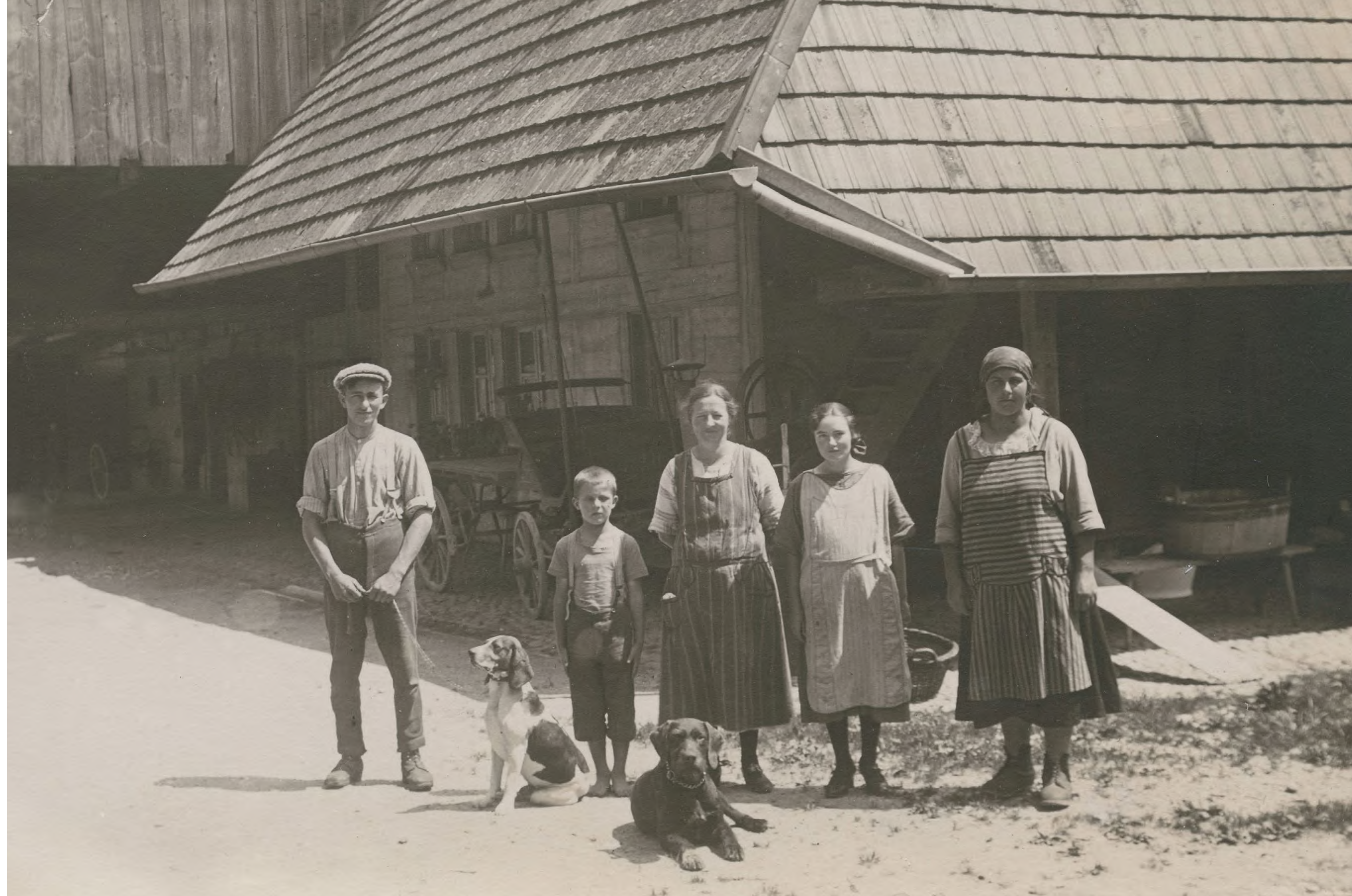
Familie Leiser in Weingarten, um 1925