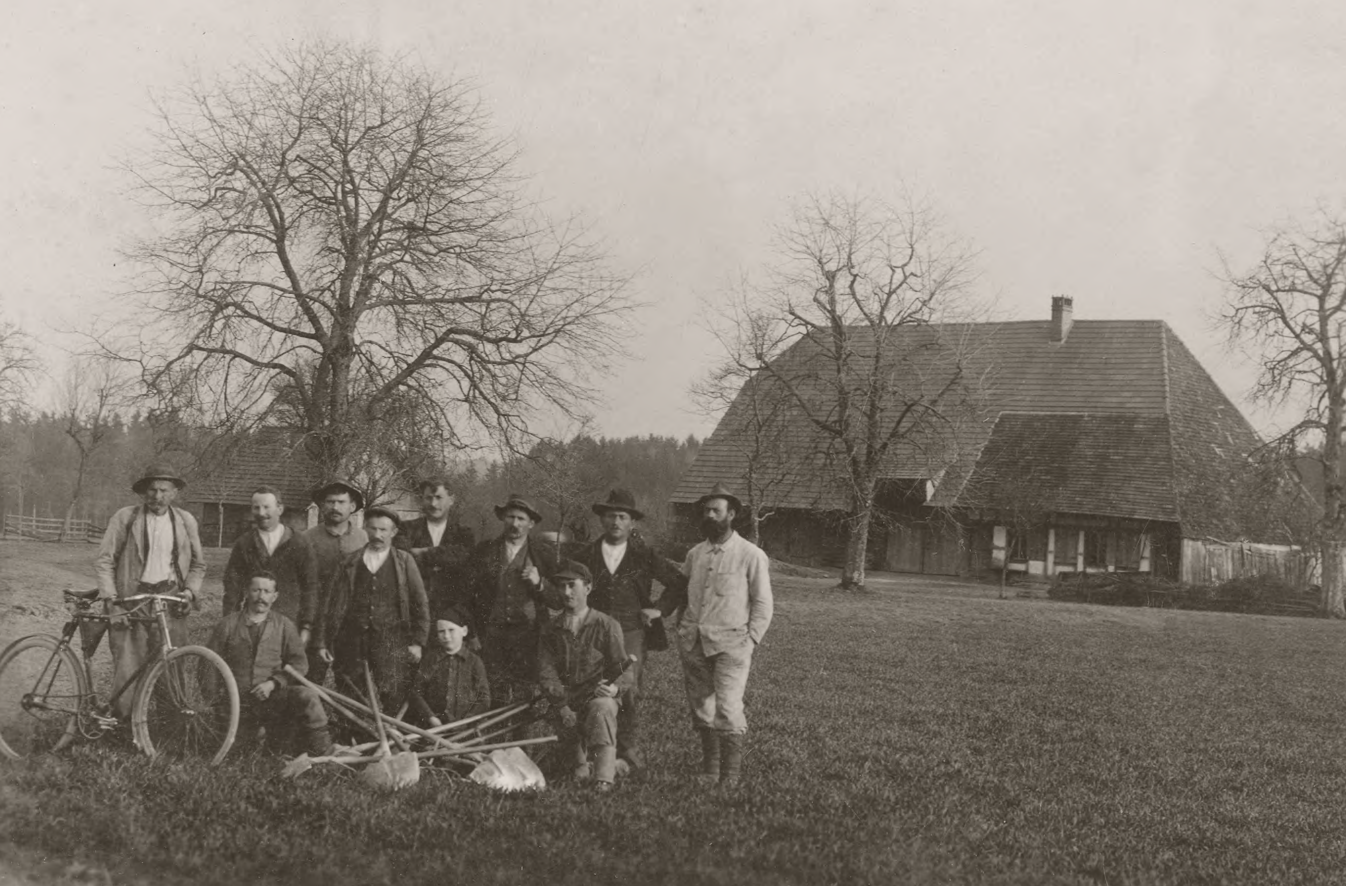
Erstellen einer Druckwasserleitung in Artishaus, Grossaffoltern, 1918