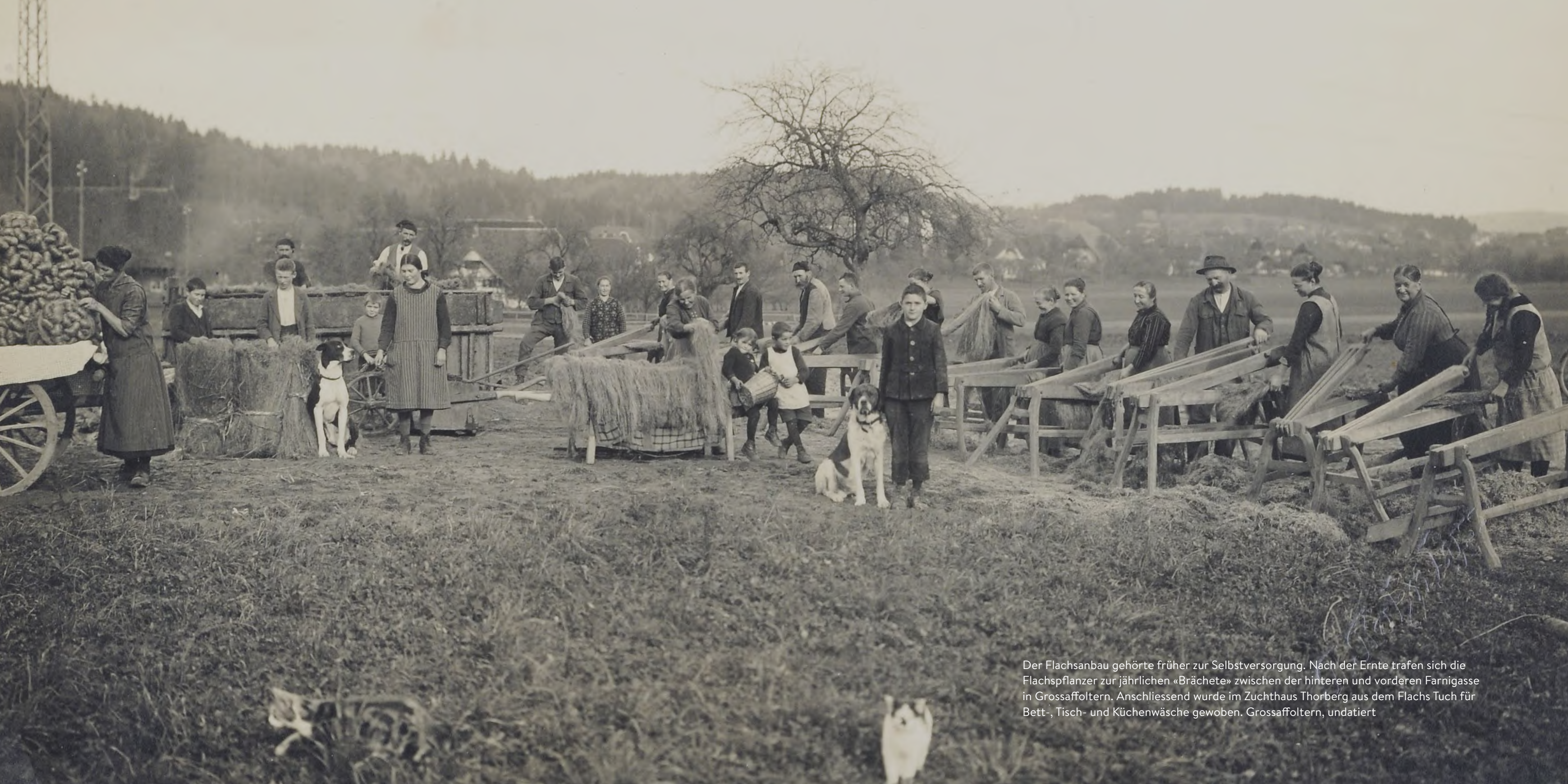
Der Flachs anbau gehörte früher zur Selbstversorgung. Nach der Ernte trafen sich die Flaxspinner zur jährlichen «Brächet» zwischen der hinteren und vorderen Farnigasse in Grossaffoltern. Anschliessend wurde im Zuchthaus Thorberg aus dem Flachs Tuch für Bett-, Tisch- und Küchenwäsche gewoben. Grossaffoltern, undatiert