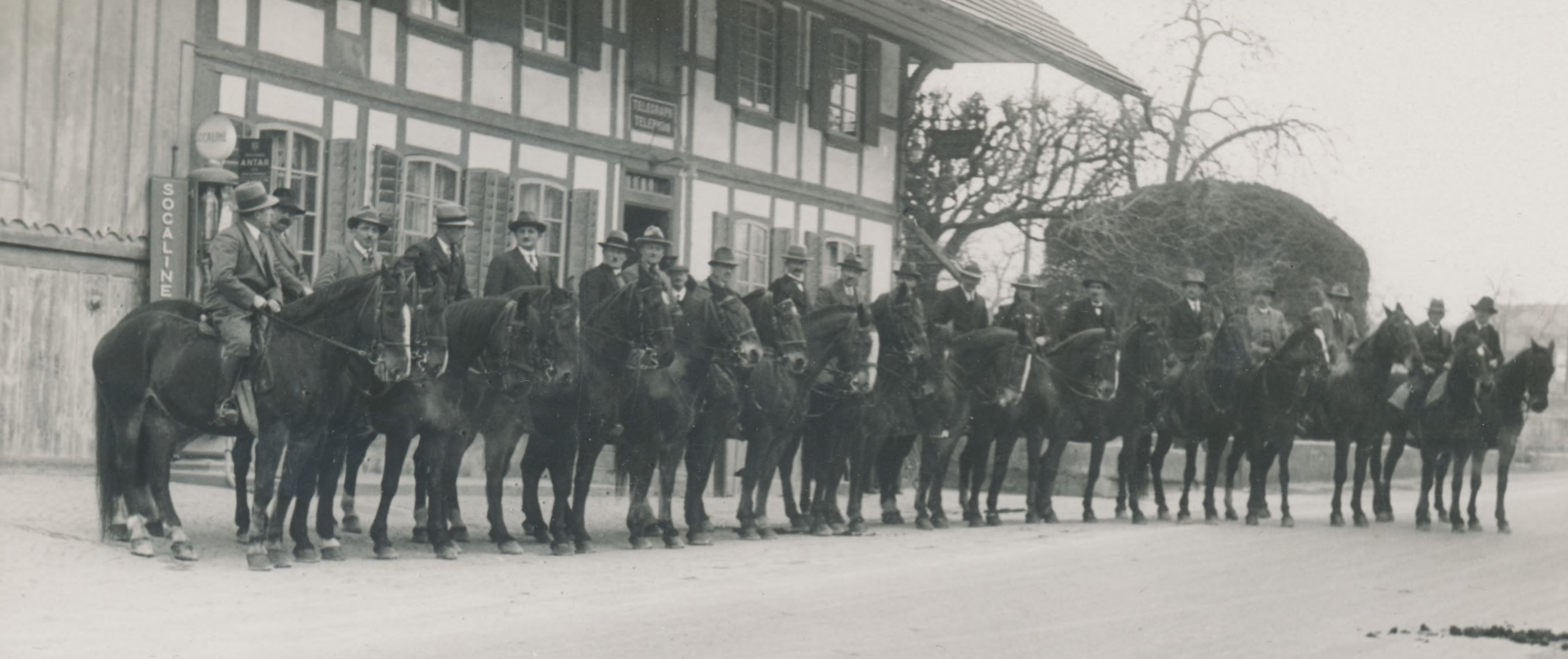
Die sogenannten «Mondscheinkosaken» bestehend aus ehemaligen Dragonern aus dem Kavallerieverein Lyssbachtal und Reiterfreunden aus der Region vor dem Restaurant Bahnhof (heute Goldener Krug), Suberg, undatiert