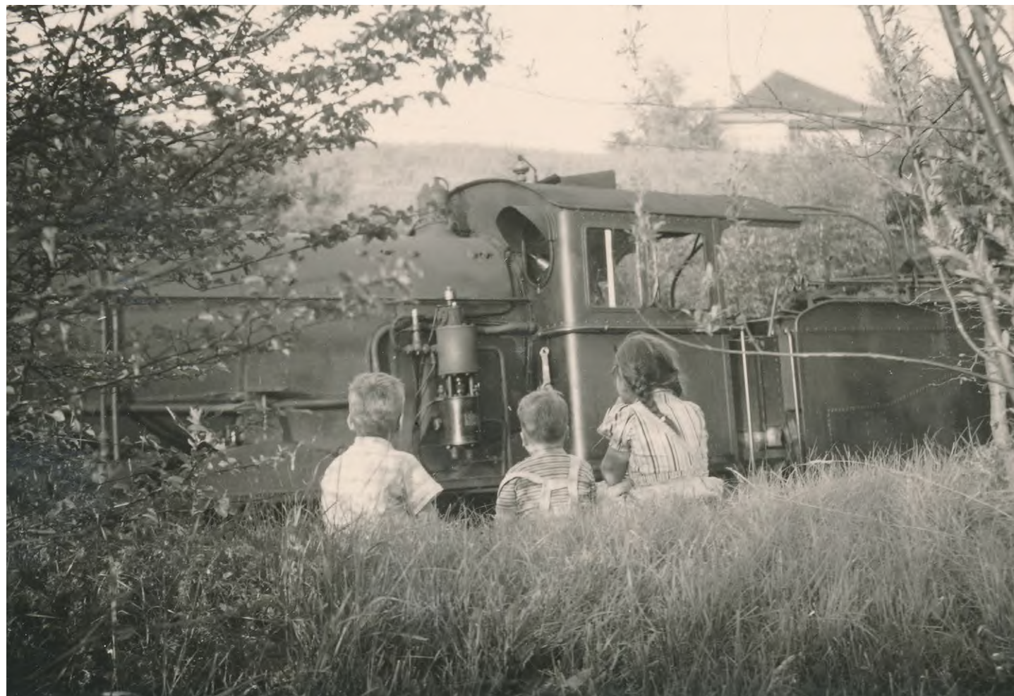
Dampflokomotive in Suberg, 1957