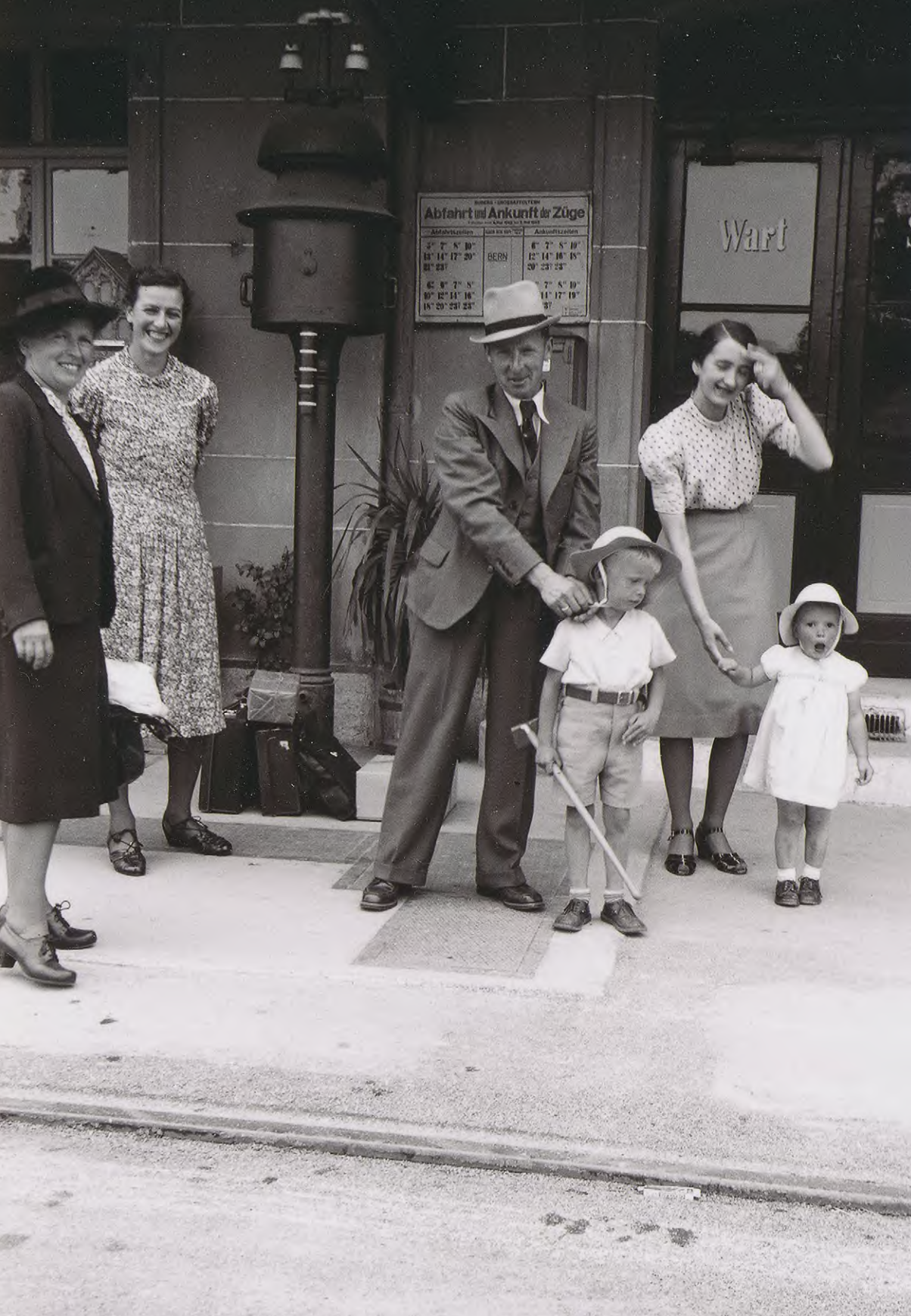
Die Familie Affolter nach einem Familientreffen vor dem Bahnhof Suberg, 1942