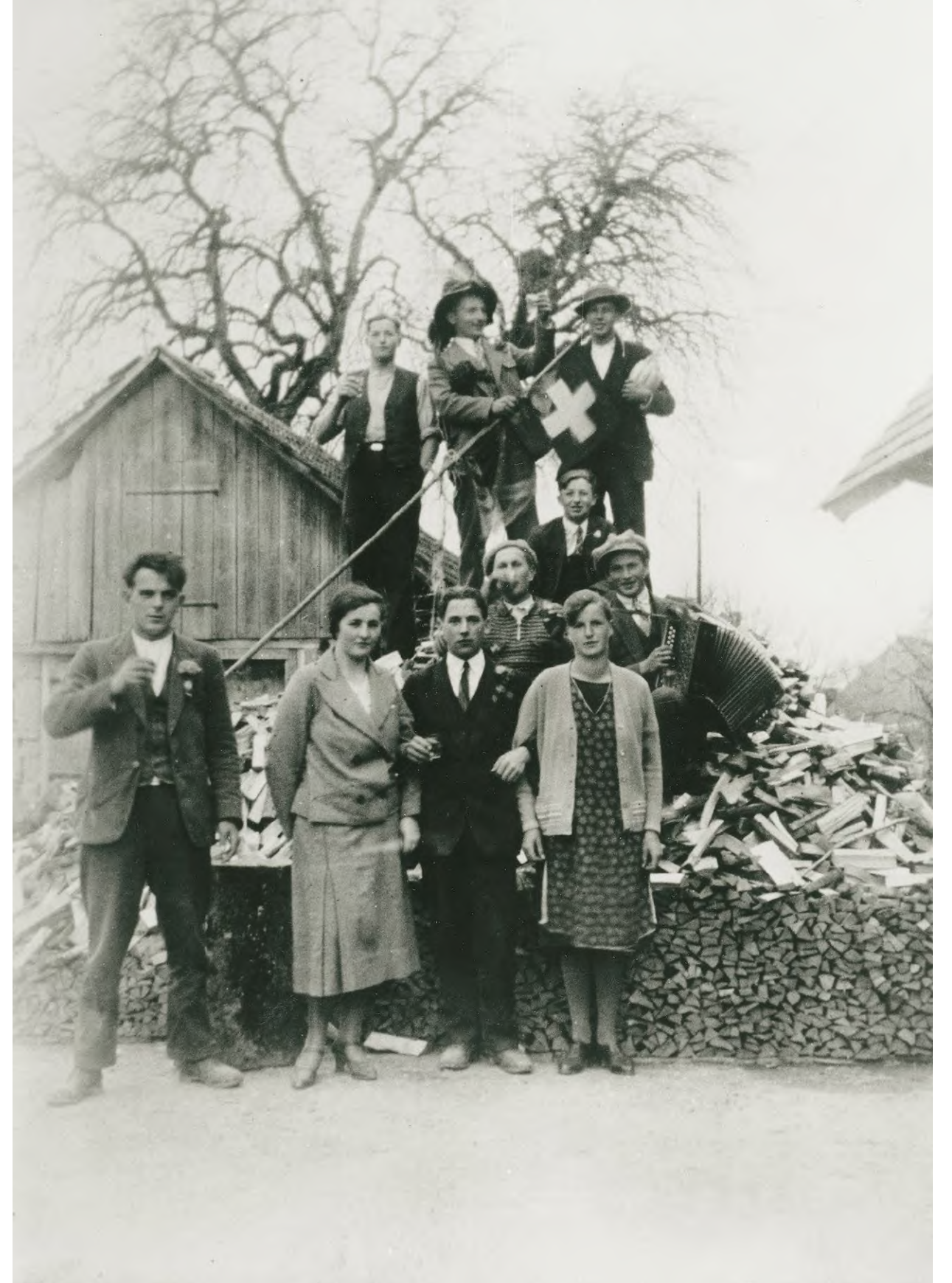
Bild rechts: Turnverein Ammerzwil nach einem Wettkampf-Ausflug, Ammerzwil, um 1930