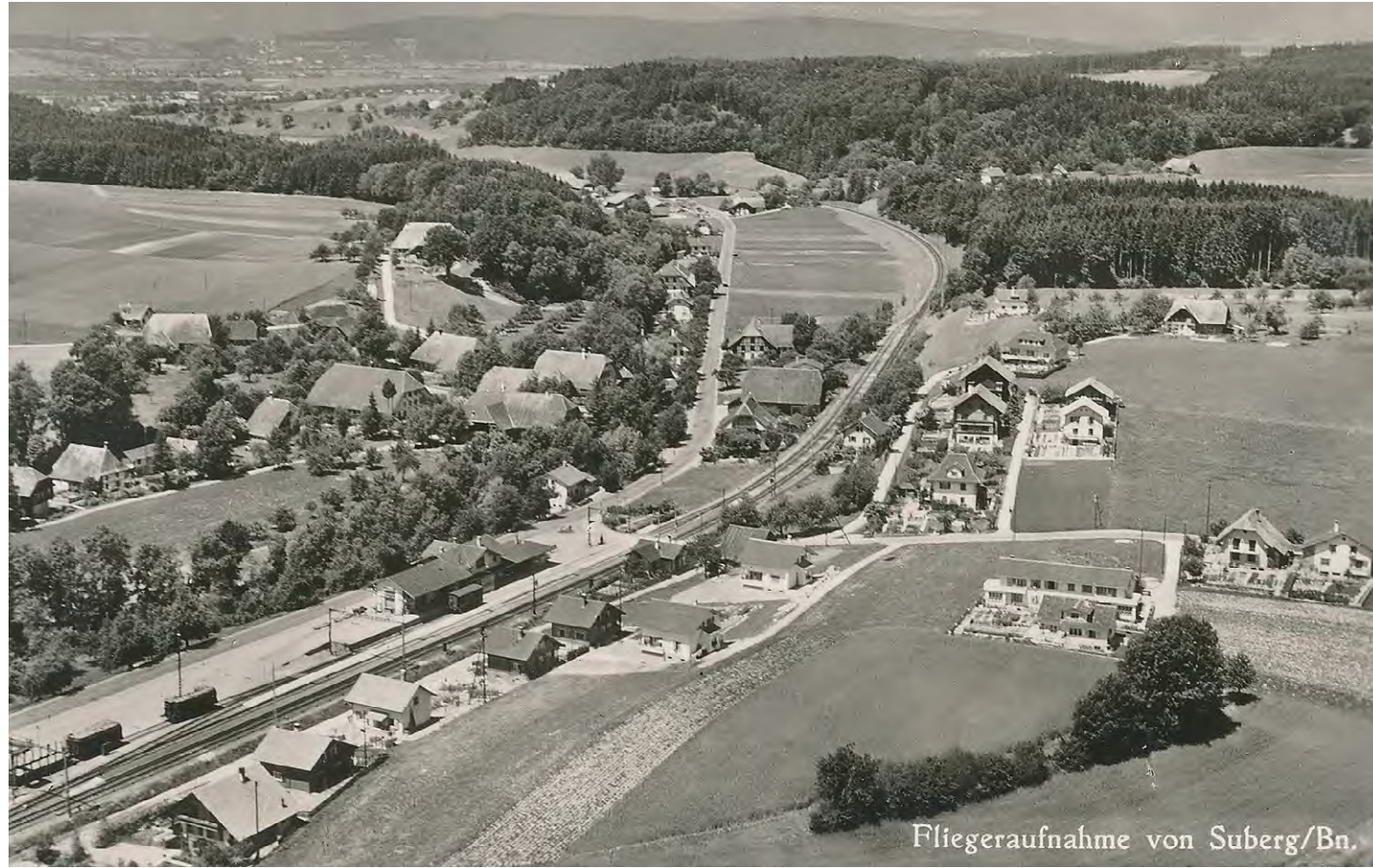
Suberg aus der Luft, um 1950