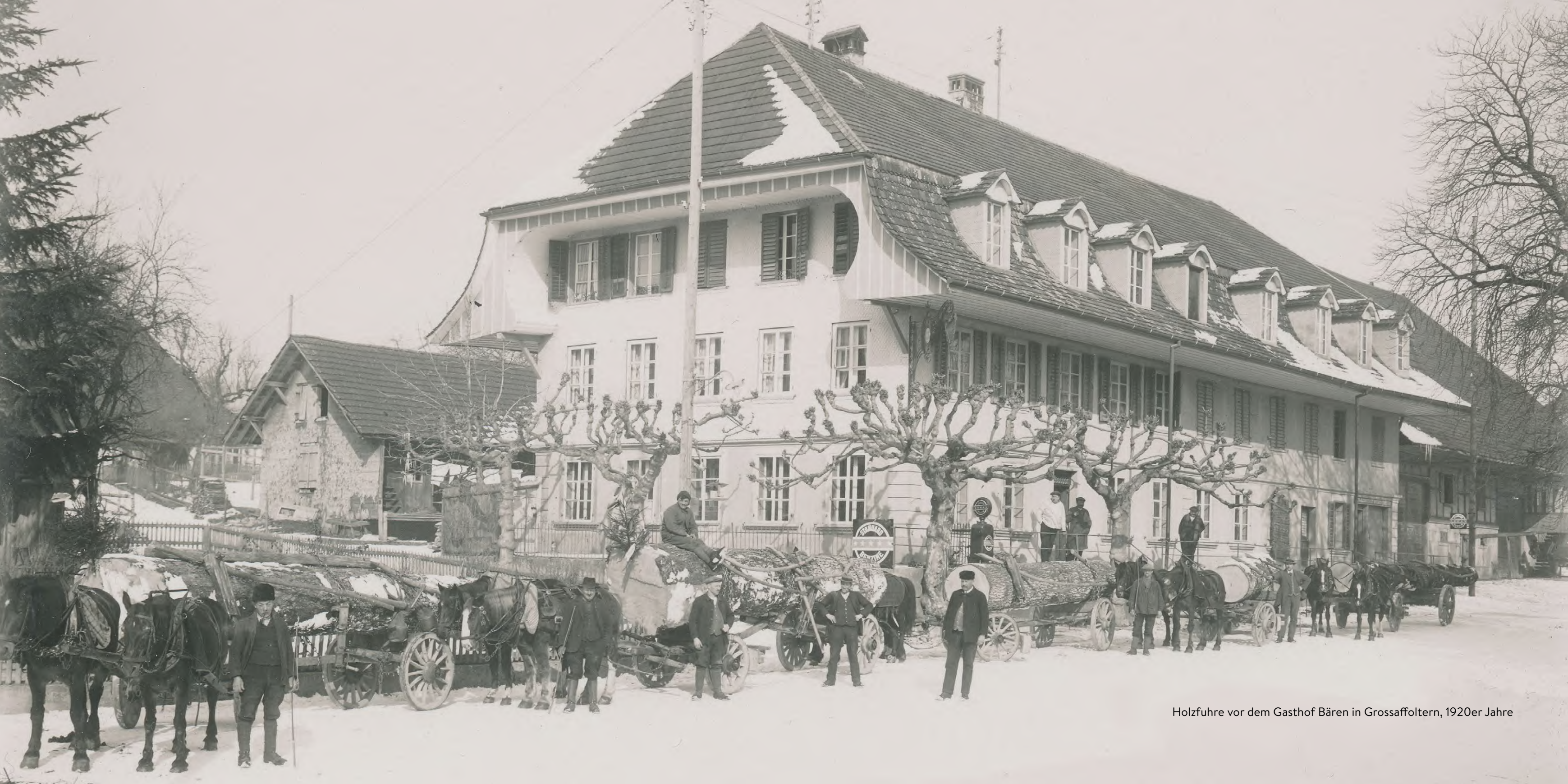
Holzfuhrer vor dem Gasthof Bären in Grossaffoltern, 1920er Jahre