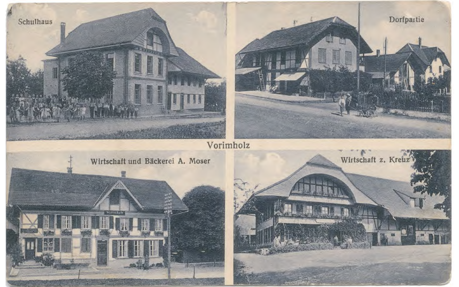
Postkarte, Vorimholz, 1932