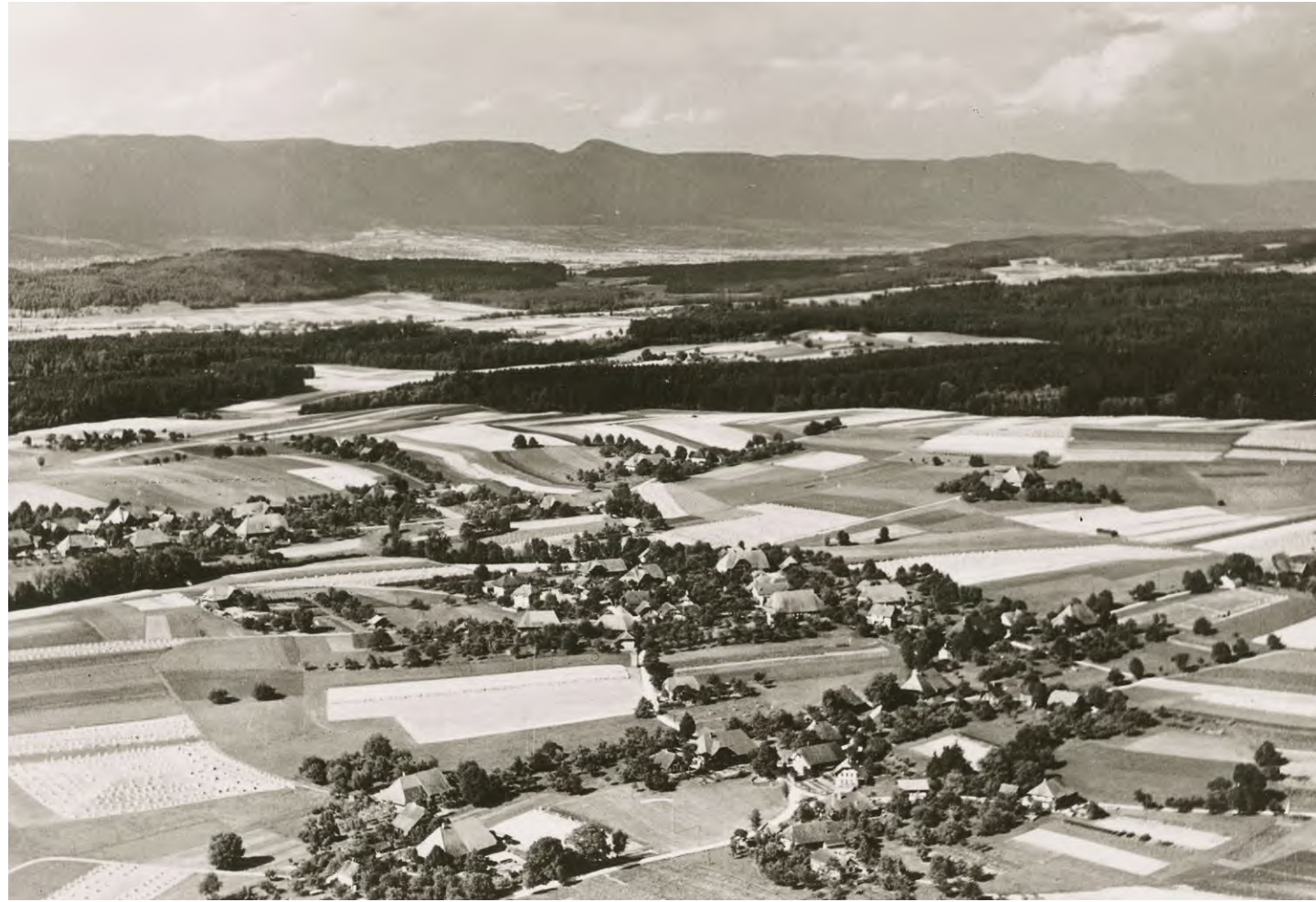
Ammerzwil aus der Luft, 1957