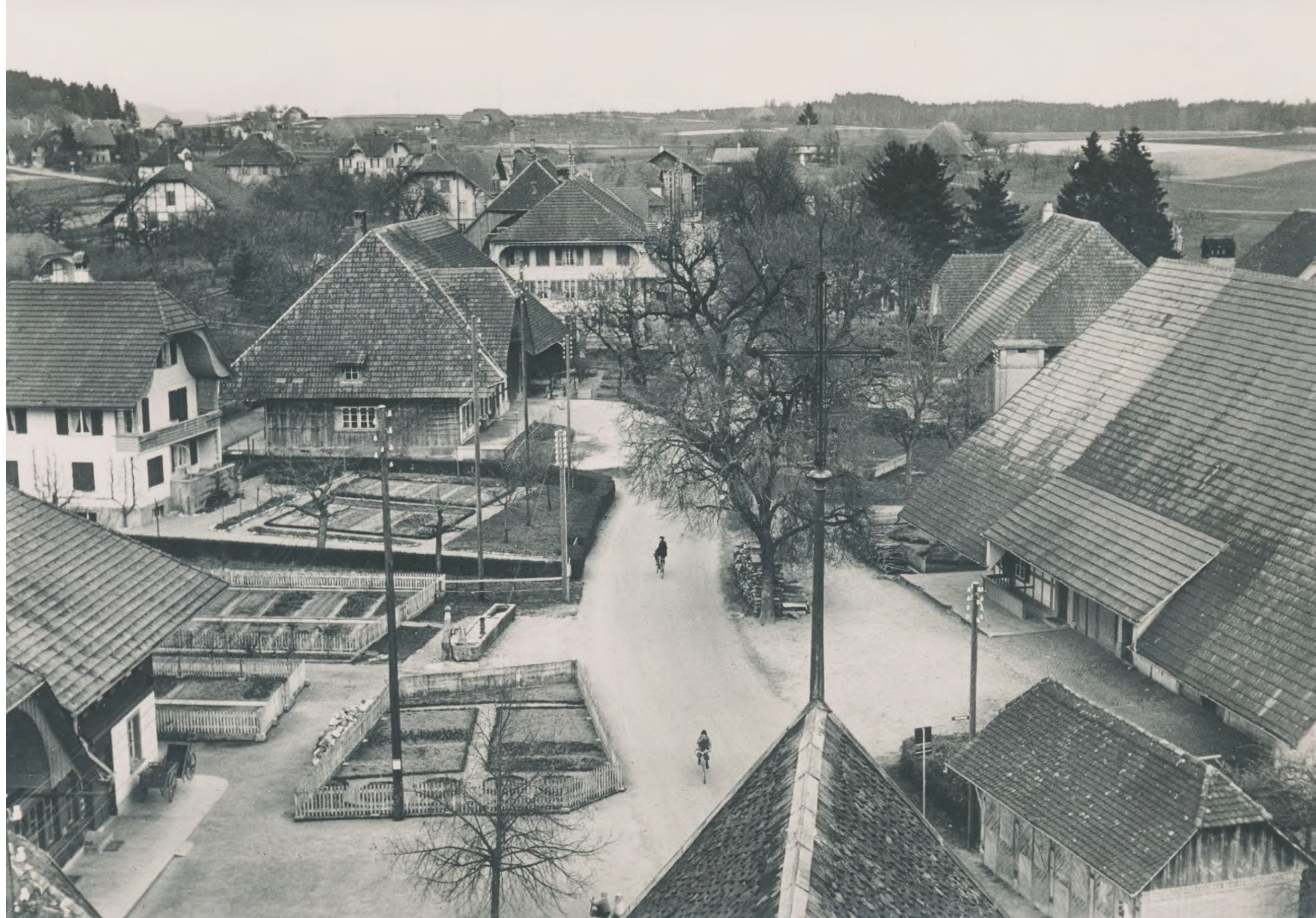
Dorfzentrum Grossaffoltern aus Kirchturm fotografiert, undatiert