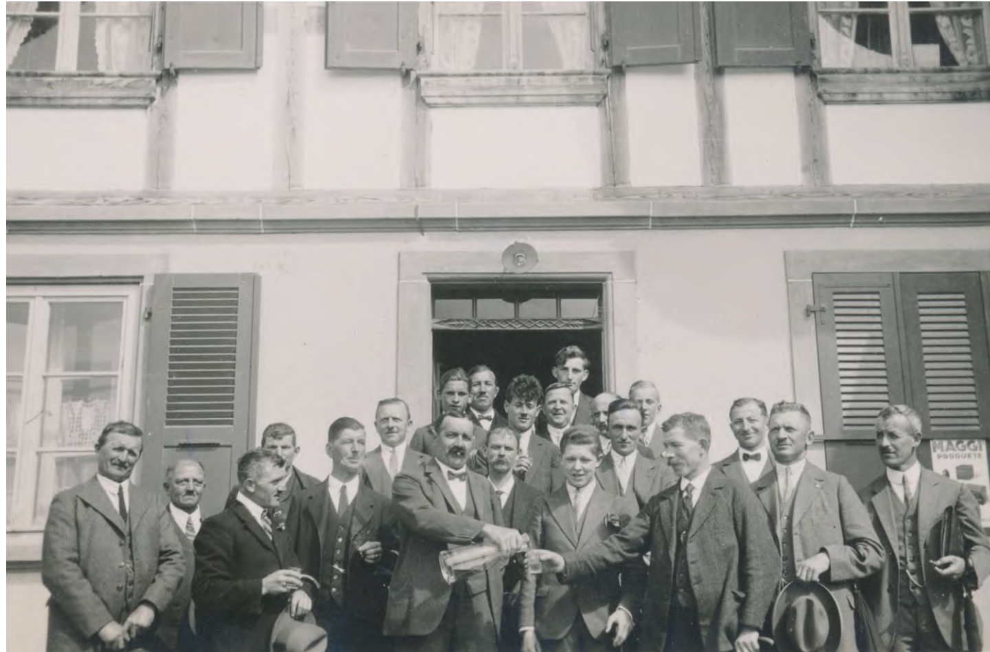
Männerchor Ammerzwil, um 1950