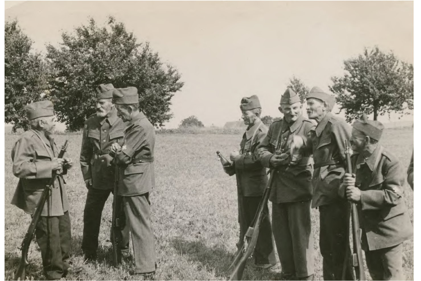
Die Ortswehr Ottiswil während dem zweiten Weltkrieg. Ottiswil, 1943