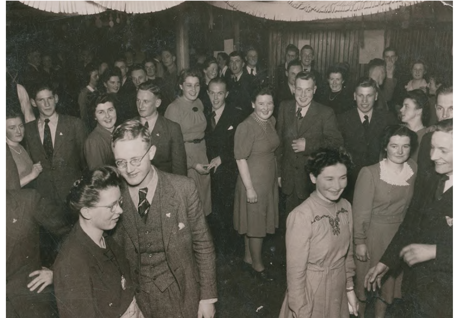
Tanzabend im Gasthof Bären, Grossaffoltern, Ende 1940er Jahre