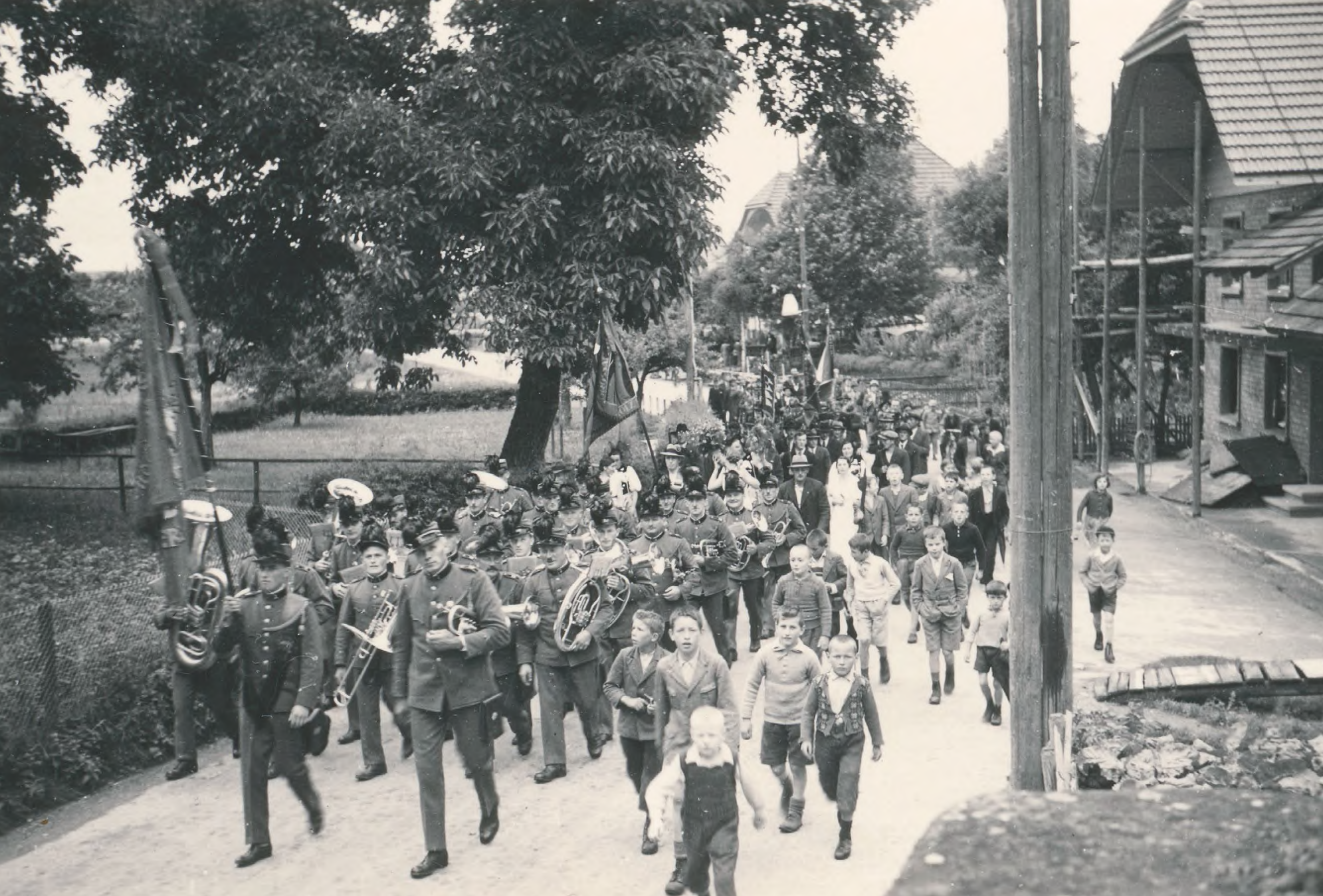
Musikgesellschaft Suberg-Grossaffoltern während eines Umzugs in Grossaffoltern, 1937