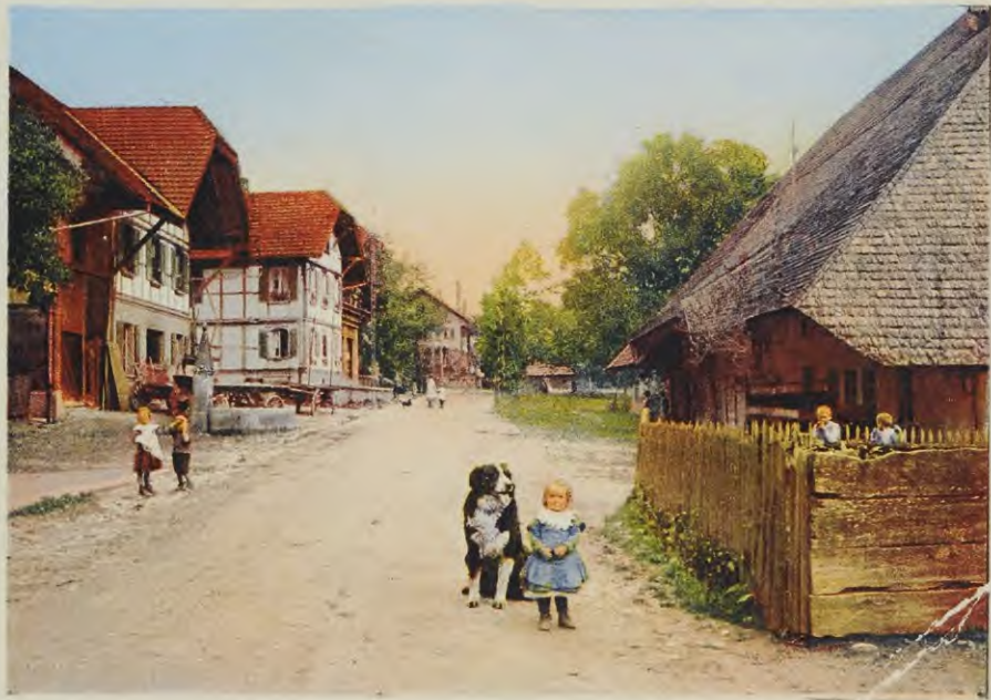
Postkarten koloriert, Grossaffoltern, 1919