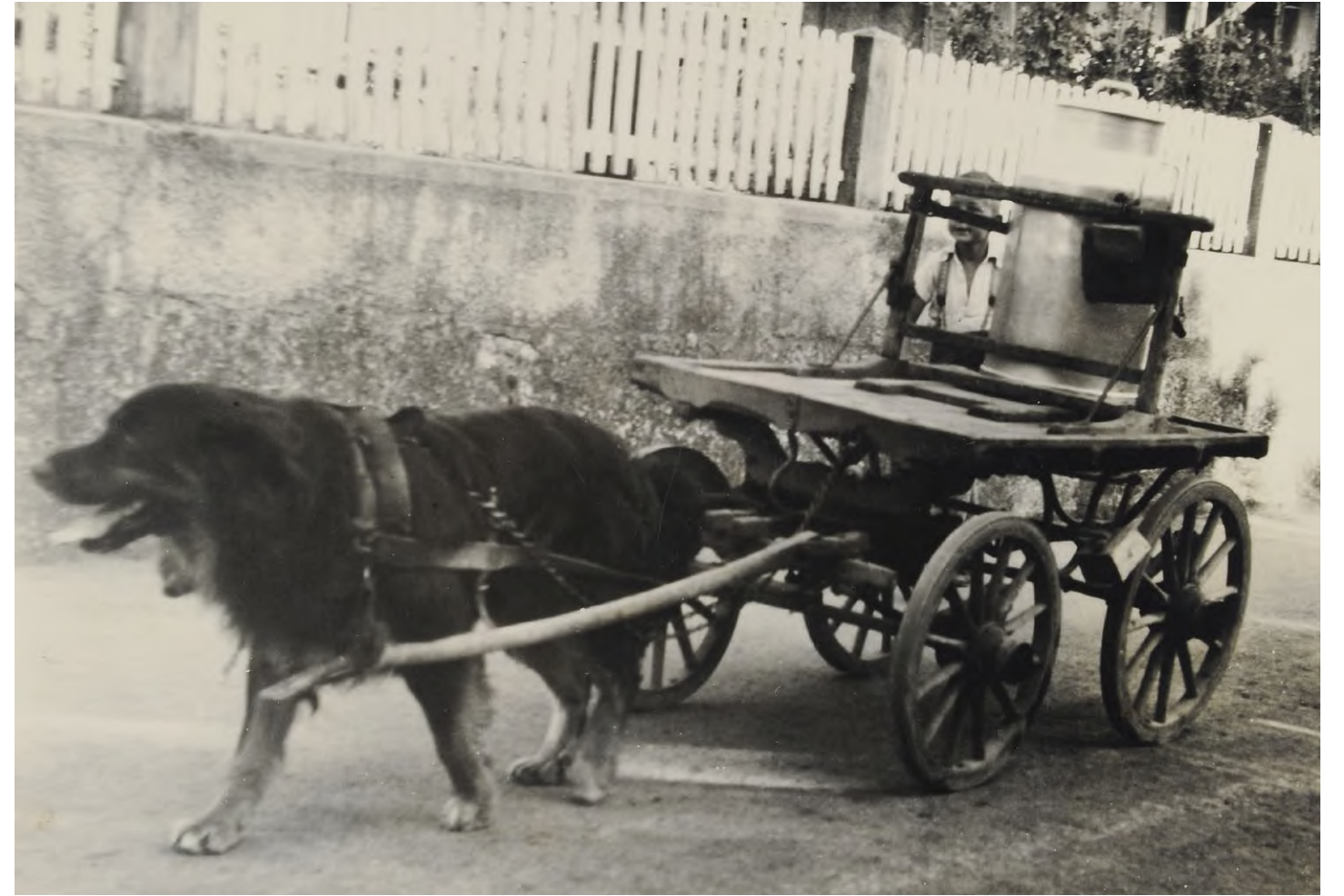
Ueli Bucher mit Hund Prinz auf dem Weg zur Käserei, Grossaffoltern, 1956