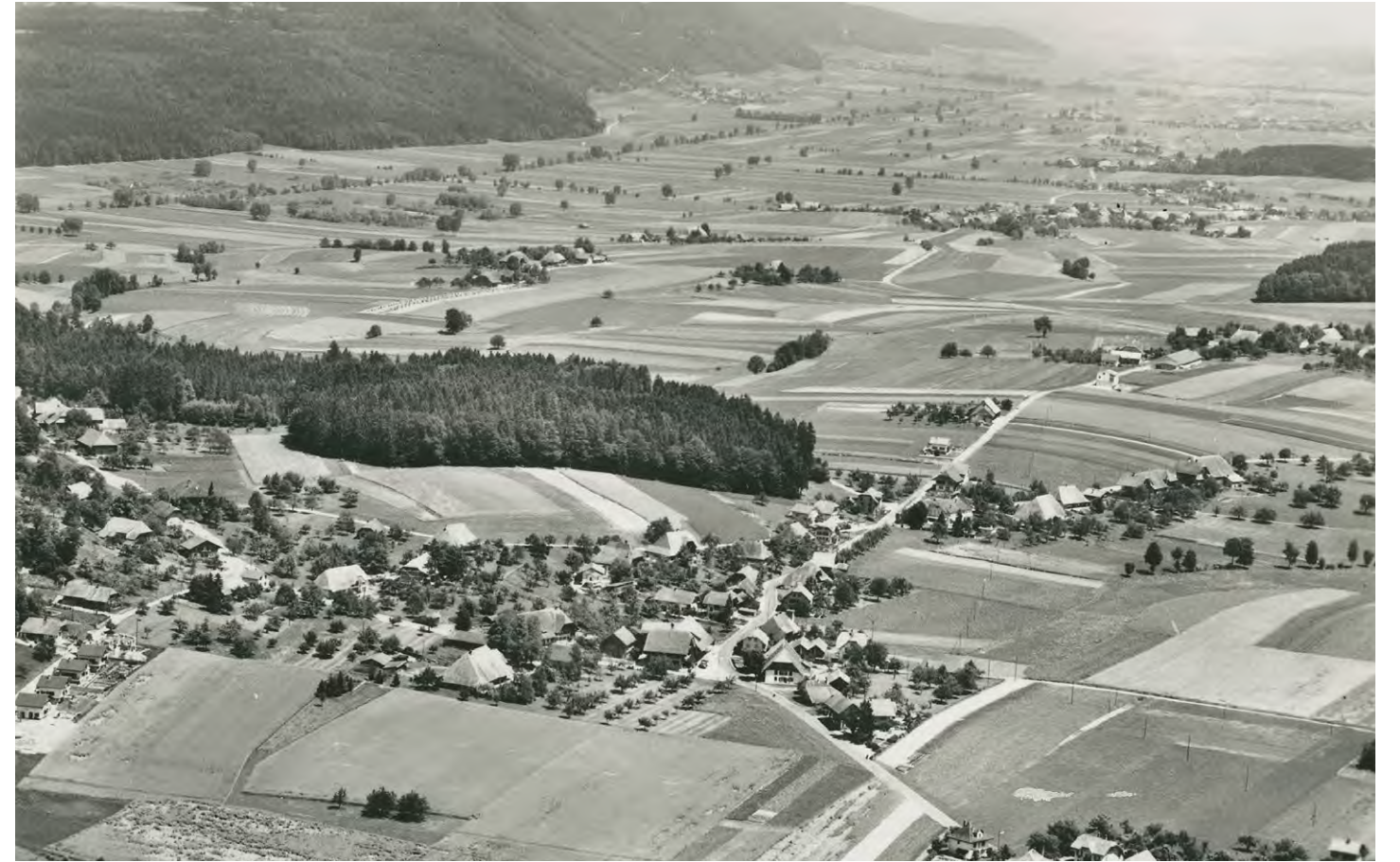
Vorimholz aus der Luft, um 1965