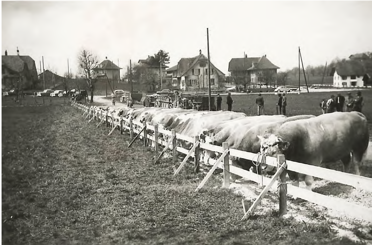
Viehschau an der Schulhausstrasse in Grossaffoltern, undatiert