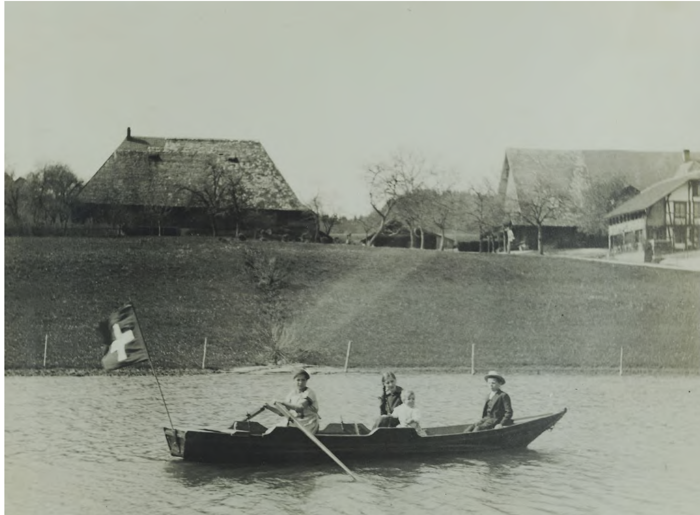
Familie Hänni auf dem Golihubweiher. Der Golihubweiher verlandete langsam und war bis zur Güterzusammenlegung praktisch ausgetrocknet. Während der Güterzusammenlegung wurde der heutige Fluhweiher wiederhergestellt. Vorimholz, um 1915