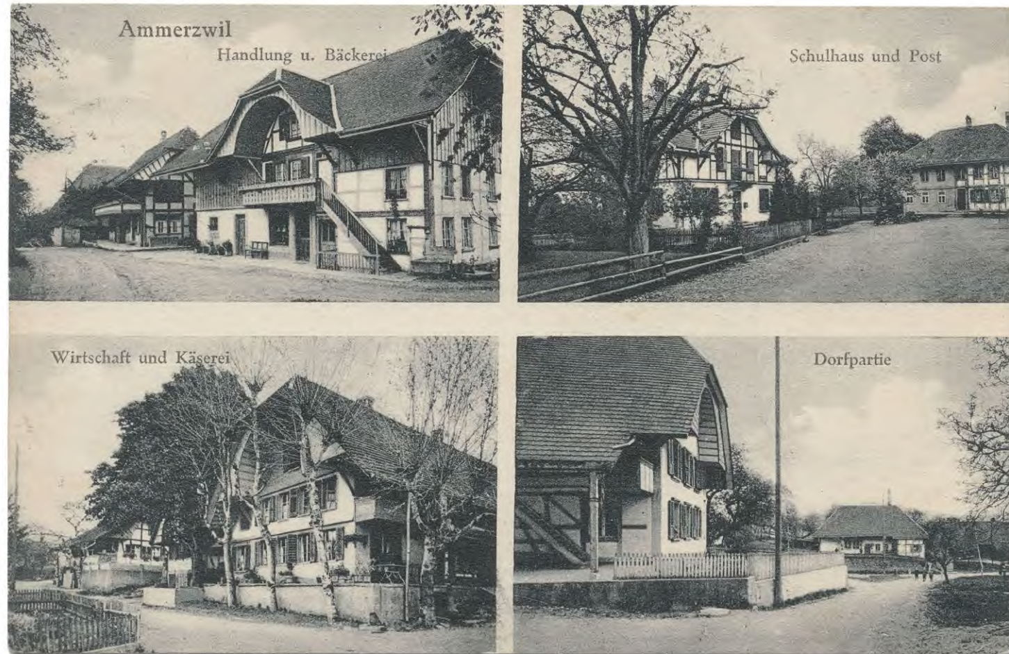
Postkarte, Ammerzwil, 1932