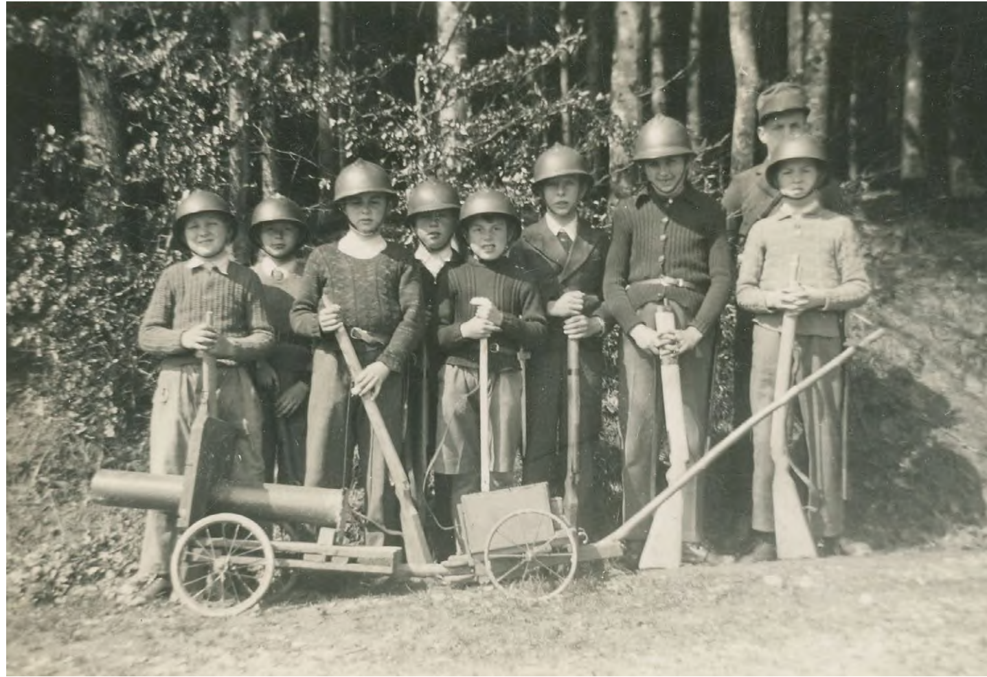
Die Kinder aus Grossaffoltern gaben den polnischen Internierten jeweils ein Holzbrett, eine Blechbüchse und zwei «Päckli Cigaretten». Nach einer Woche bekamen sie von ihnen ein sorgfältig geschnitztes Holzgewehr mit Eisenbeschlägen zurück. Grossaffoltern, 1942