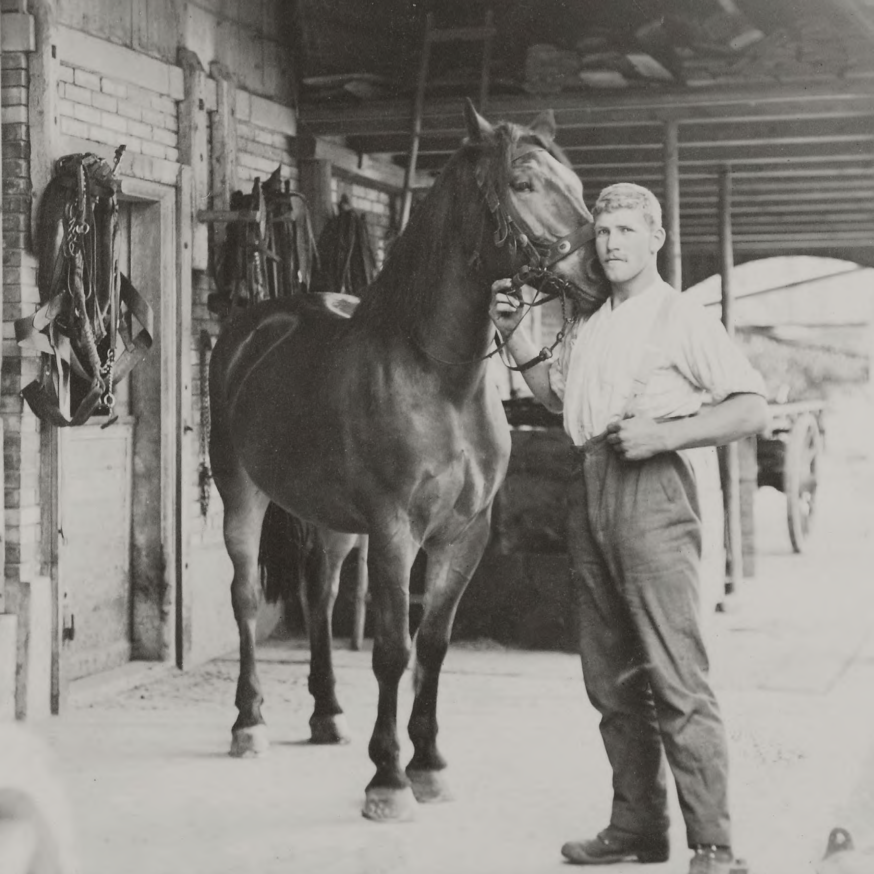
Schmiede Affolter, Grossaffoltern, um 1920