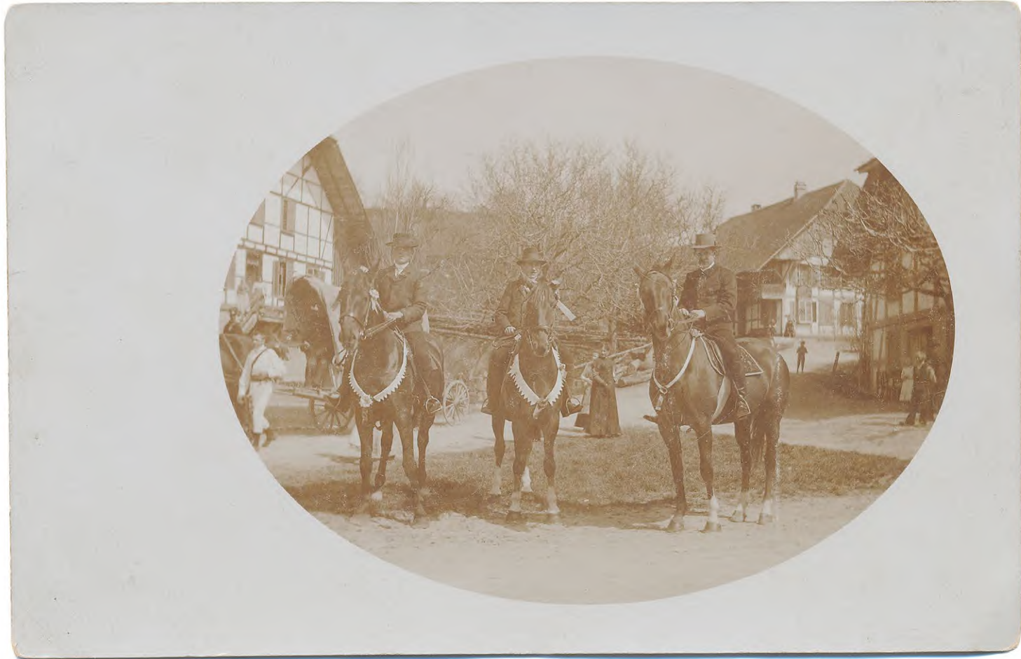
Postkarte, Kosthofen, um 1925