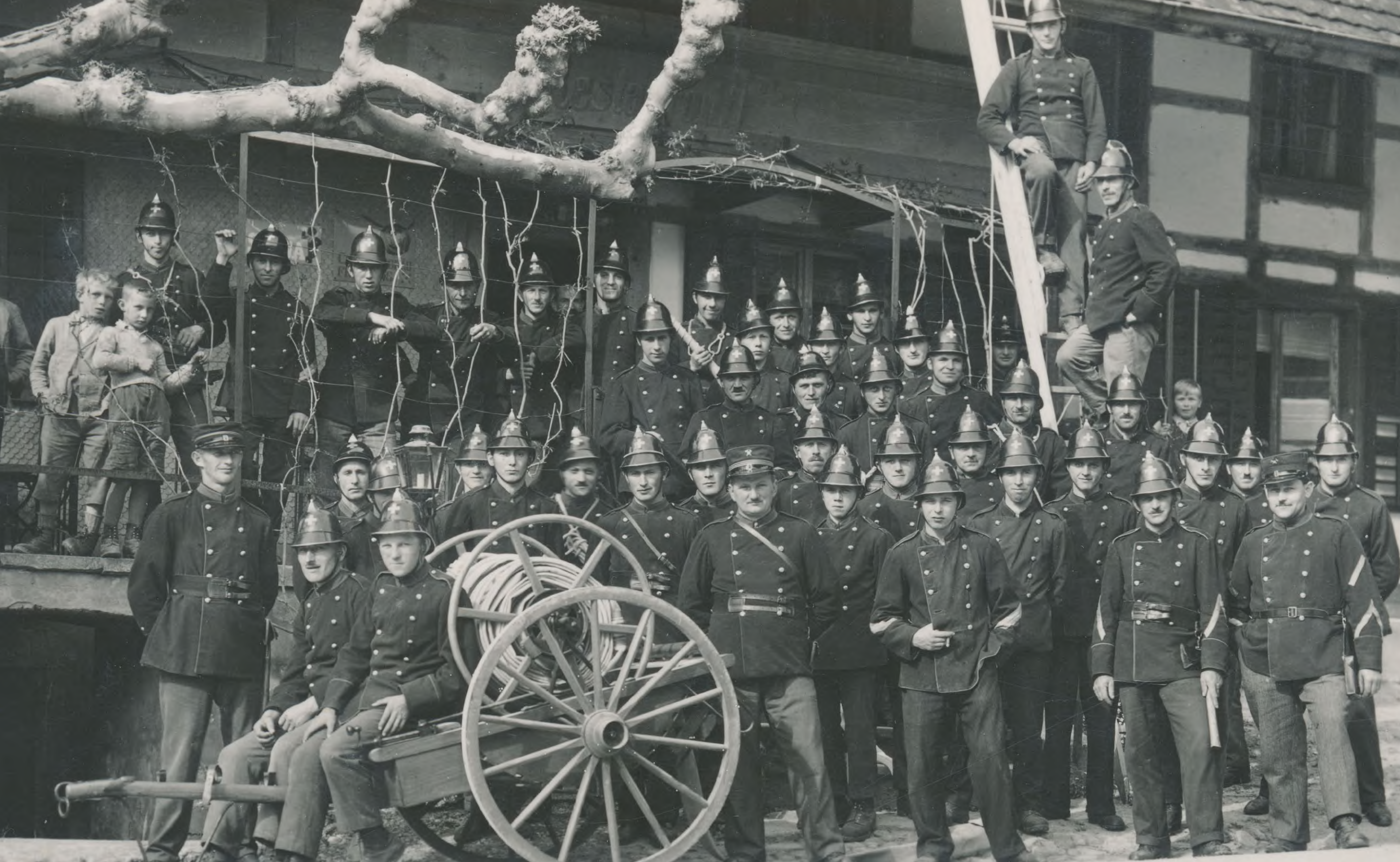
Feuerwehr Ammerzwil vor dem Restaurant Kreuz in Ammerzwil, um 1935