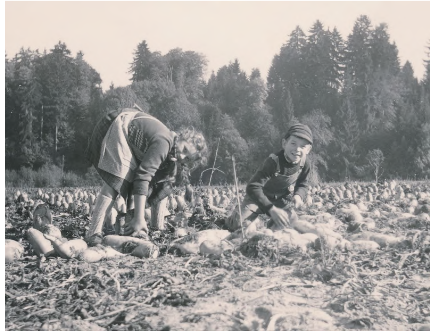
Kinder bei der Ernte von «Runggle» (Futterrüben), Kosthofen, 1962