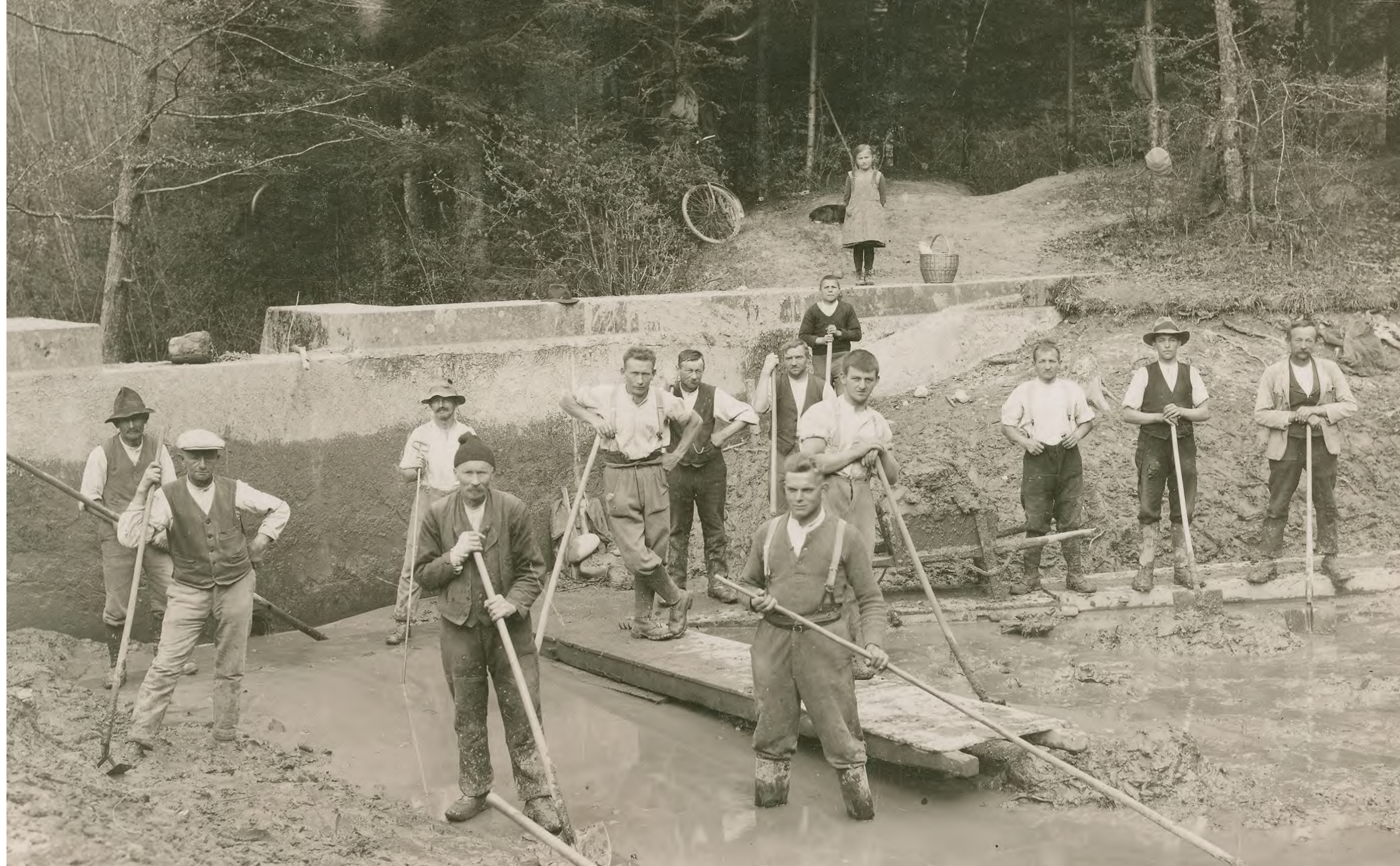
Putzete des Duftereseelis. Das Wasser wurde von der Feuerwehr als Löschwasser bei Bränden eingesetzt. Ottiswil, um 1935