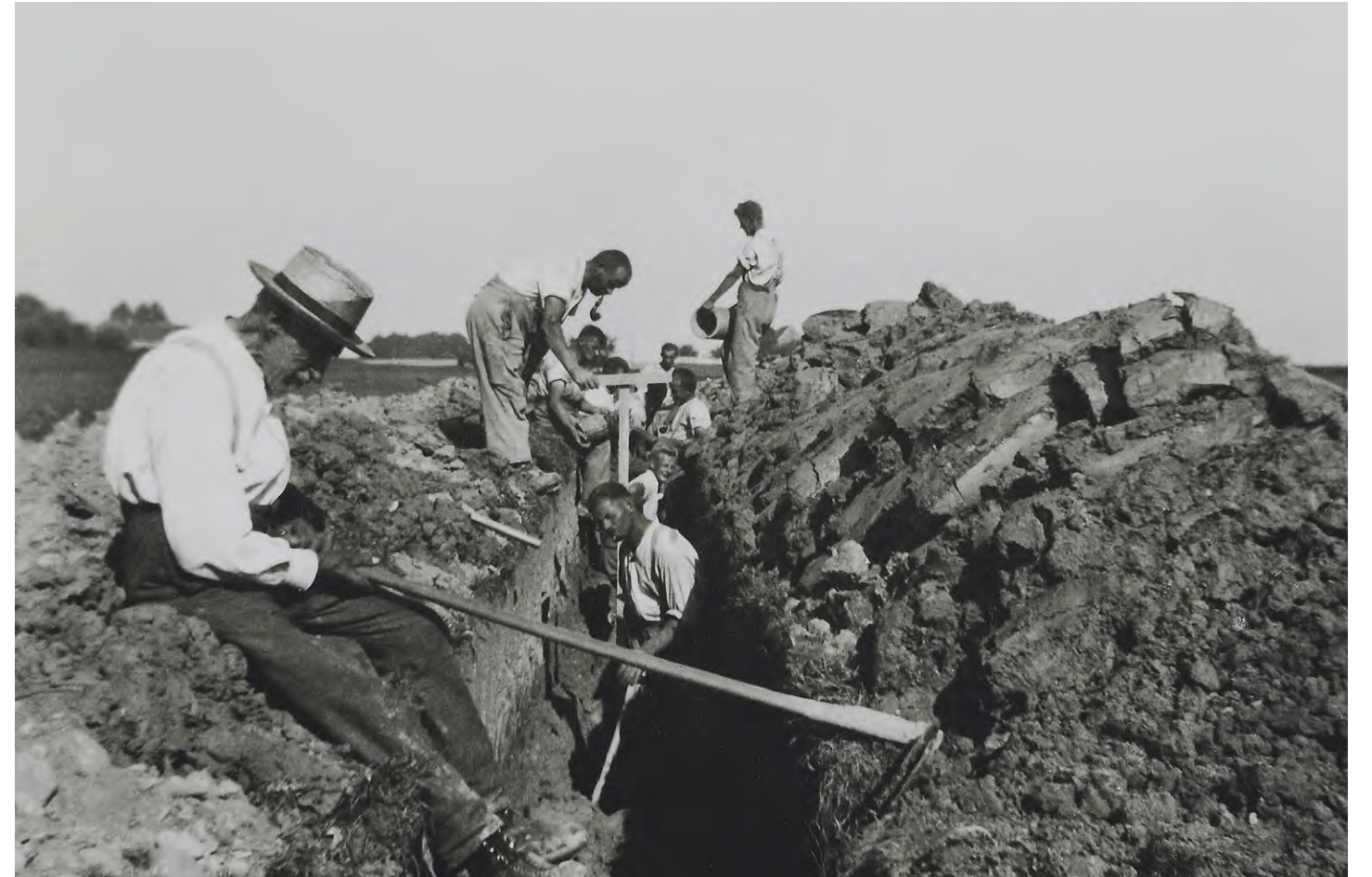
Erstellen einer Drainage, Flue in Vorimholz, um 1940