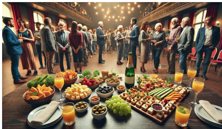
Mit ChatGPT generiertes Bild «Apéro nach Gemeindeversammlung»